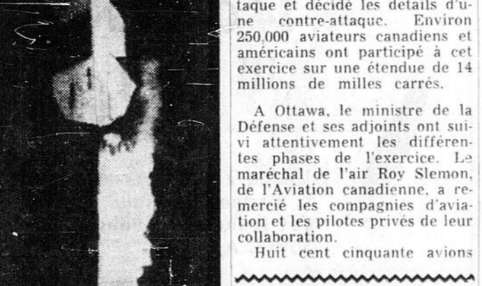
LES BOMARC arriveront aux bases de North Bay et de La Macaza au cours de la semaine. La photo ci-haut nous en montre un en plein vol. A North Bay, toutefois, les travaux d'électricité ne sont pas terminés et à La Macaza toutes les rampes ne seront pas prêtes avant le début de l'an prochain. Entre-temps, ils pourront être commandés par les centres américains.