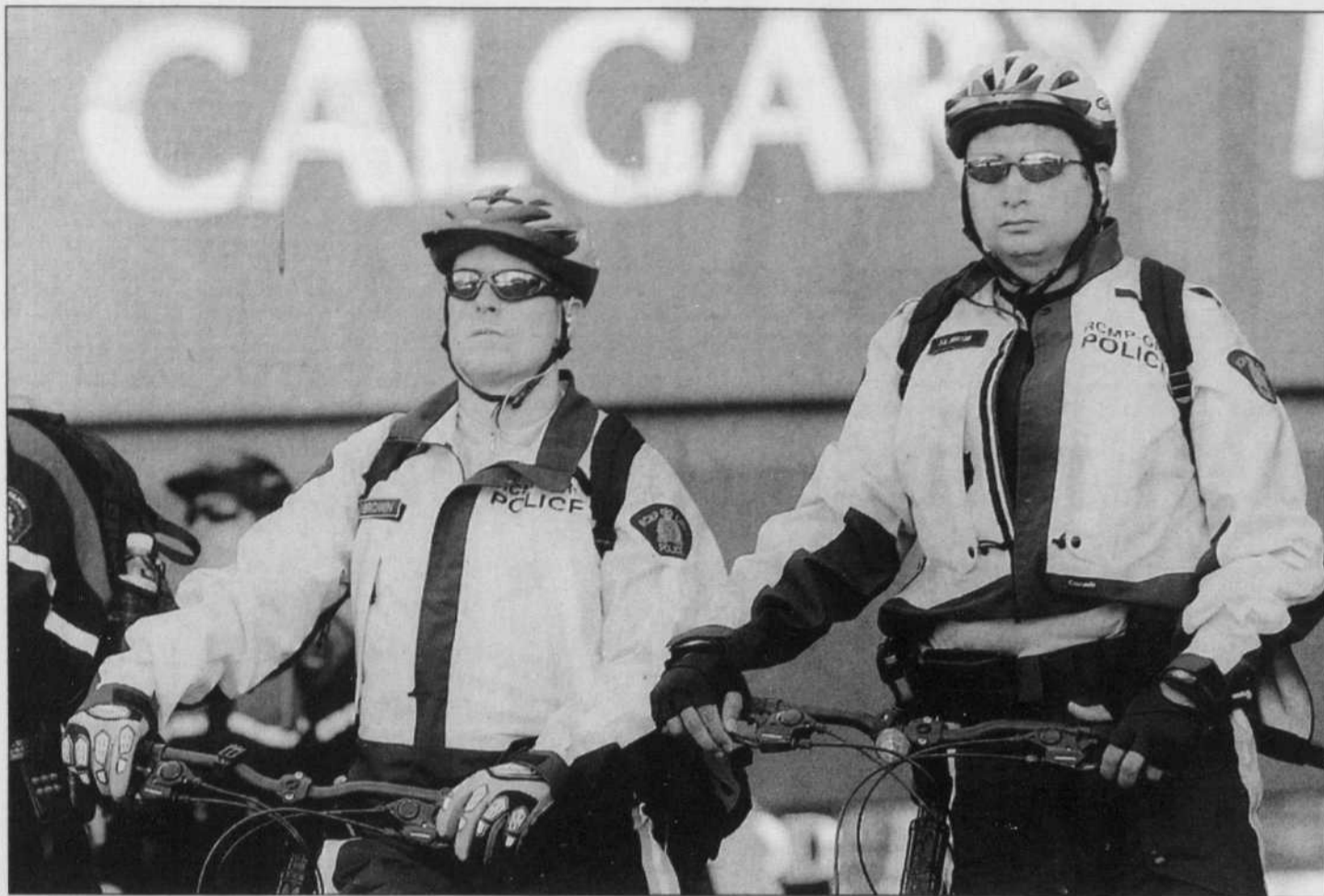
Les policiers ont employé la méthode discrète pour contrôler les manifestants à Calgary. Pas d'impressionnant uniforme anti-émeute, pas de larmoyant gaz lacrymogène, même les barrières métalliques sont restées entreposées. Les manifestants, eux, ont sagement rempli leur rôle.