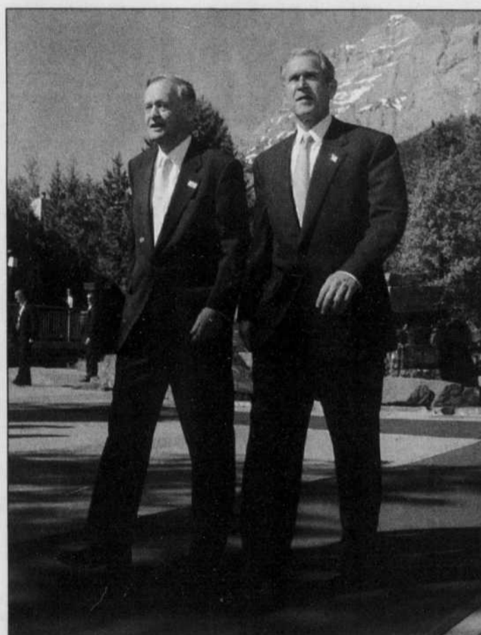
Le premier ministre Jean Chrétien fait quelques pas avec le président américain George W. Bush à Kananaskis.