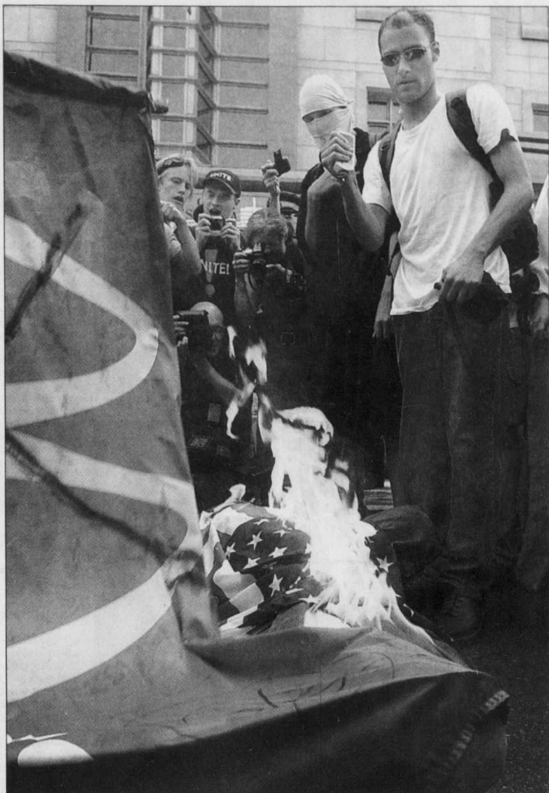
Un groupe de manifestants a brûlé une effigie de George W. Bush, un drapeau américain et un drapeau de la multinationale McDonald hier après-midi devant l'ambassade des États-Unis à Ottawa.

Le projet de Jean Chrétien de voir les pays riches accorder à l'Afrique plus de la moitié de leurs nouveaux budgets d'aide frappe le mur américain