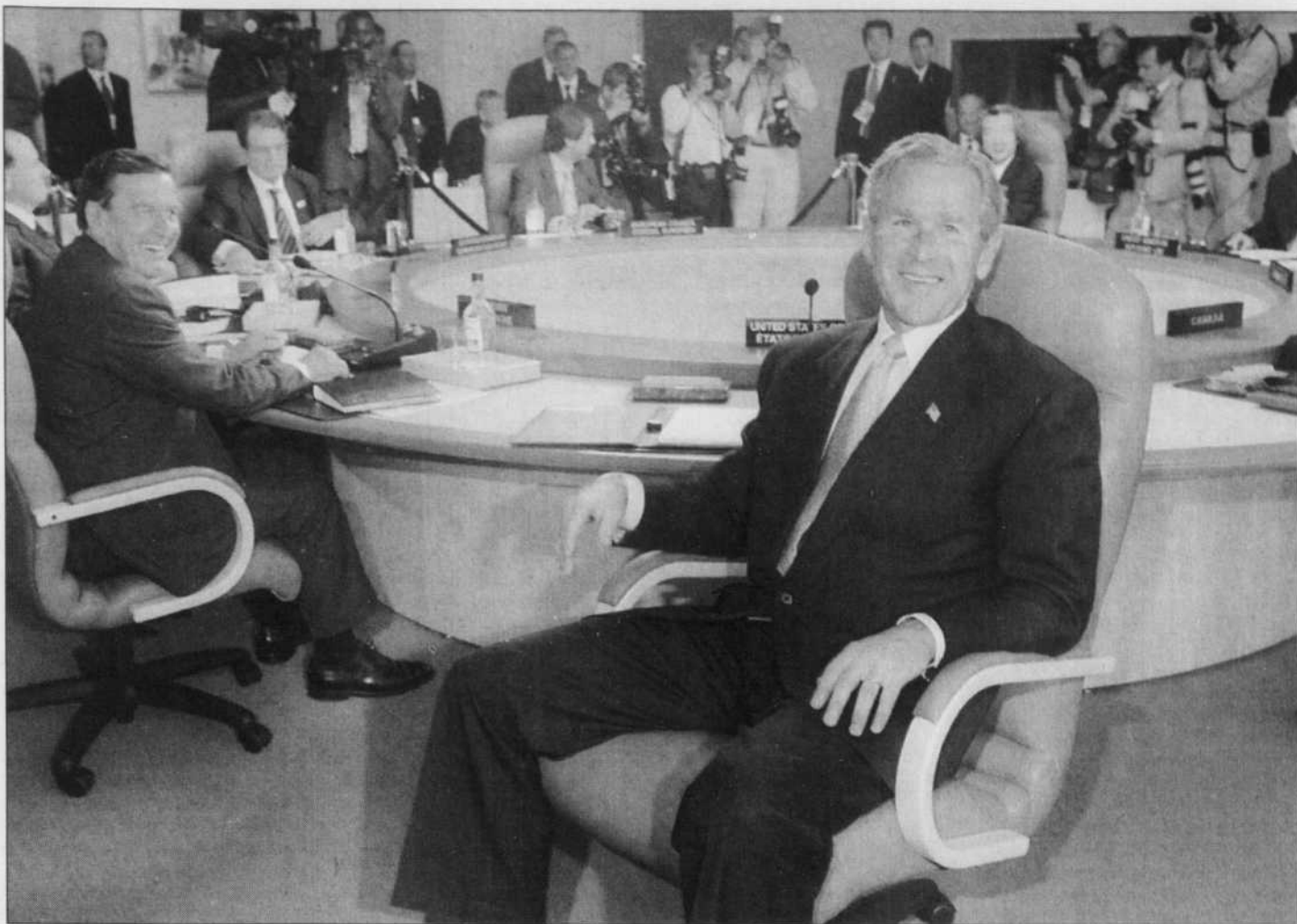
Hier s'est ouvert à Kananaskis, en Alberta, le sommet tant attendu du G8. Les plus sceptiques croient qu'il s'agira d'une réunion de plus des grands de ce monde, dont les frais d'organisation seront inversement proportionnels aux résultats.

Pour que cela ne soit pas uniquement une affaire canadienne, d'autres hauts responsables du G8 ont récemment visité l'Afrique, notamment l'ex-président américain Bill Clinton, à titre d'émissaire «des dirigeants progressistes occidentaux», suivi du secrétaire américain au Tré-