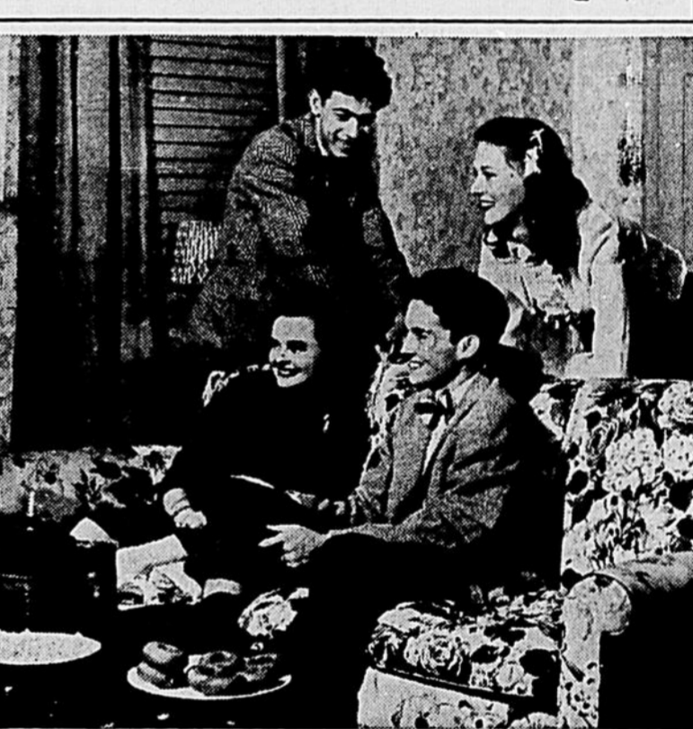
L'éclair rend sûre et facile la photo intérieure