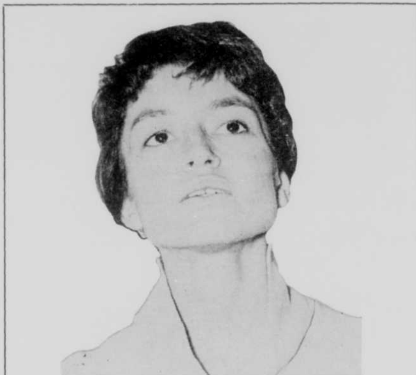
Pauline Julien, diseuse

Après la musique classique et populaire, la préférence des mélomanes des quatre villes mentionnées va, dans l'ordre, à la musique de spectacles du Broadway (vingt-six pour cent); au jazz (dix-sept pour cent); aux disques pour enfants (quinze pour cent); à la musique de folklore (treize pour cent) et, enfin, aux mélodies de cow-boys (dix pour cent).