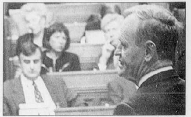
Jean Chrétien et Lucien Bouchard: «Là, chapeau».

Tour à tour, Jean Chrétien, Lucien Bouchard et Preston Manning ont pris la parole sur le projet de société distincte en attendant de poursuivre à compter d'au-