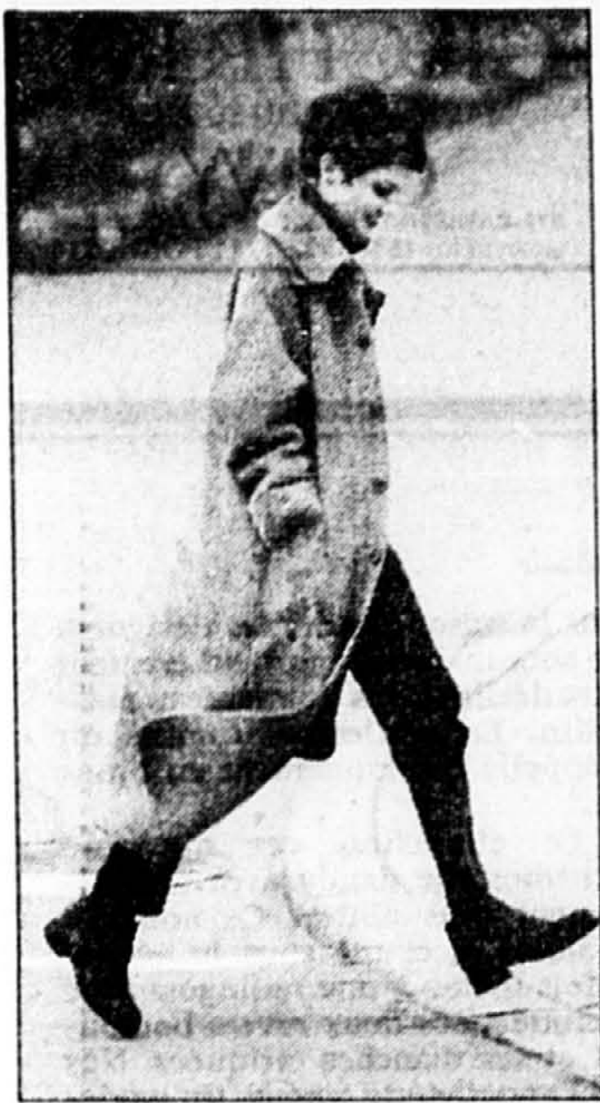
Modèle de Hilary Radley avec col et poignets de mouton montré en page 1.