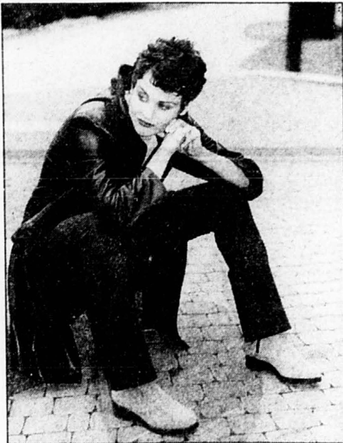
Manteau de cuir signé Oscar Léopold, 700 $. Pull à col roulé, gilet, 42 $, 45 $ tous offerts chez Gap. Pantalon extensible Teenflo, 195 $.