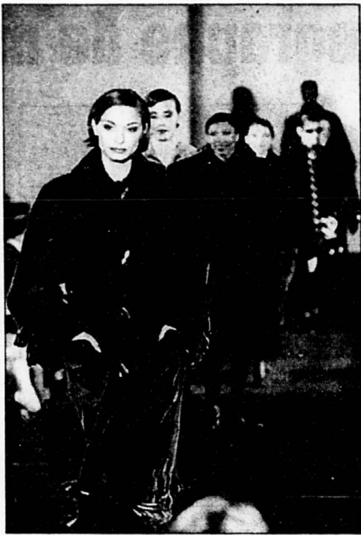
Le défilé des griffes québécoises s'est déroulé la semaine dernière à la Place Montréal Trust.