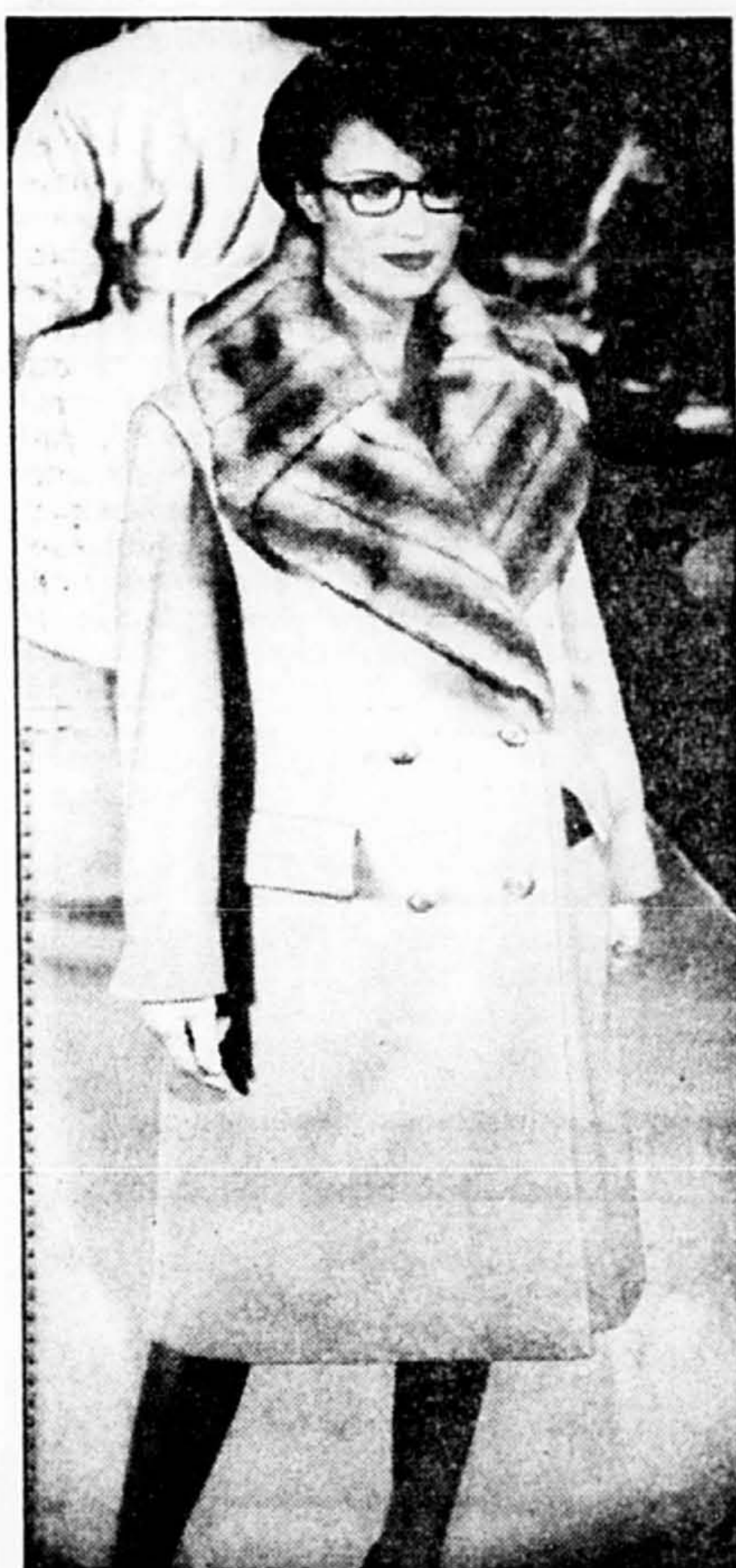
Le manteau-redingote coupé sous le genou est très populaire cet automne.

« L'époque des vêtements gadgets, c'est du passé. Les consommateurs ont aujourd'hui le gros bout du bâton et réclament des vêtements passe-partout », conclut la designer.