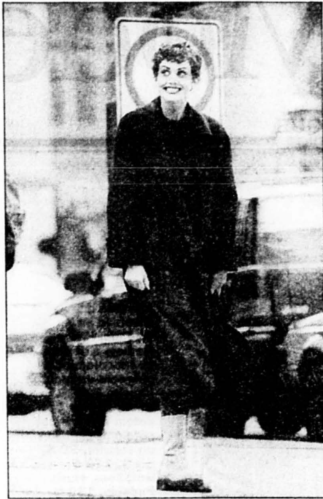
Manteau-ridingote noir en angora-cachemire griffé Teenflo, 695 $. Robe polo de laine Esprit 89 $. Collant Dim, 20 $. Bottes Hush Puppies, 140 $.