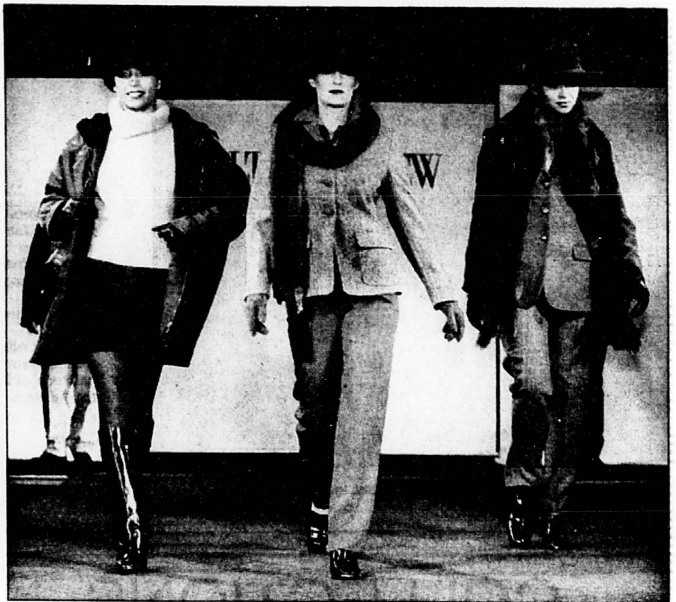
Le défilé du grand magasin Holt Renfrew donnait un bon aperçu des tendances internationales.