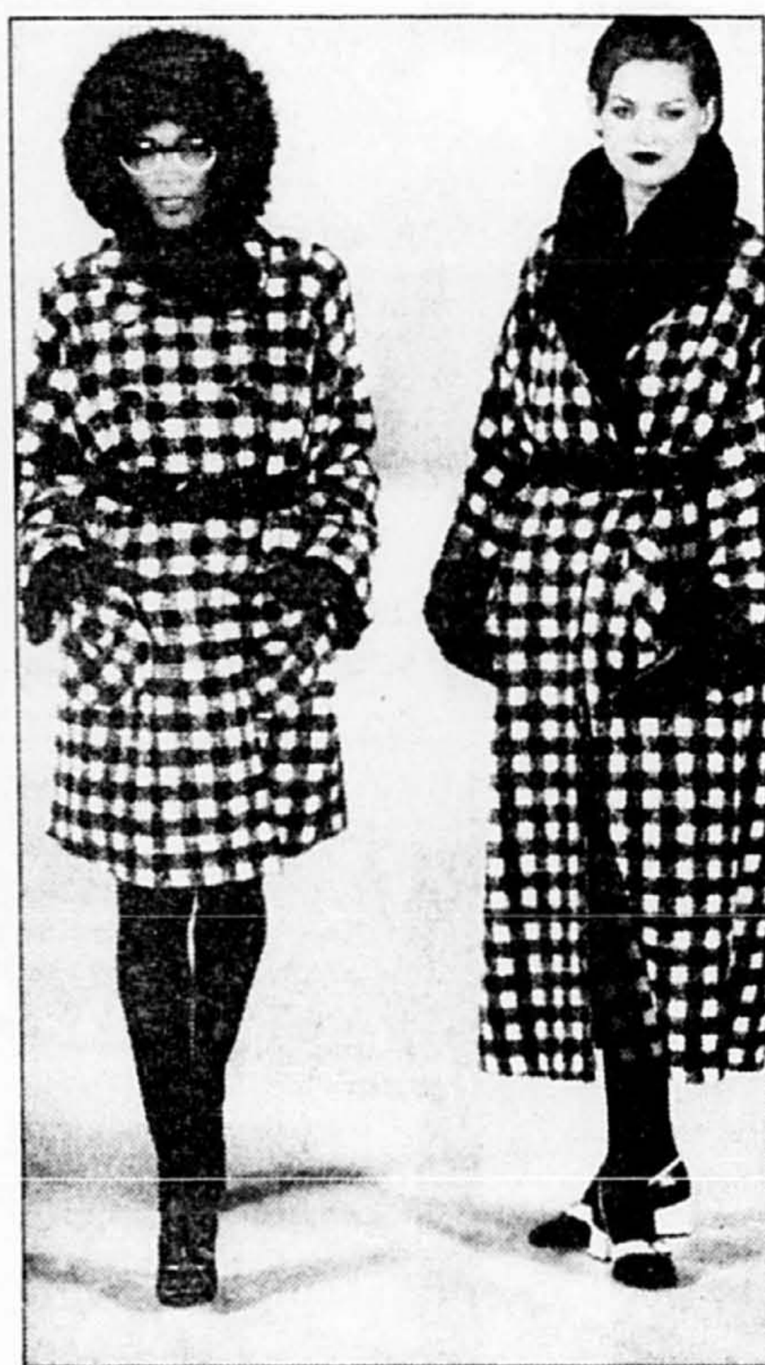
Variation de styles avec du pied-de-poule géant.

Célébrez l'ouverture de notre nouveau magasin LAURA Place Ville-Marie