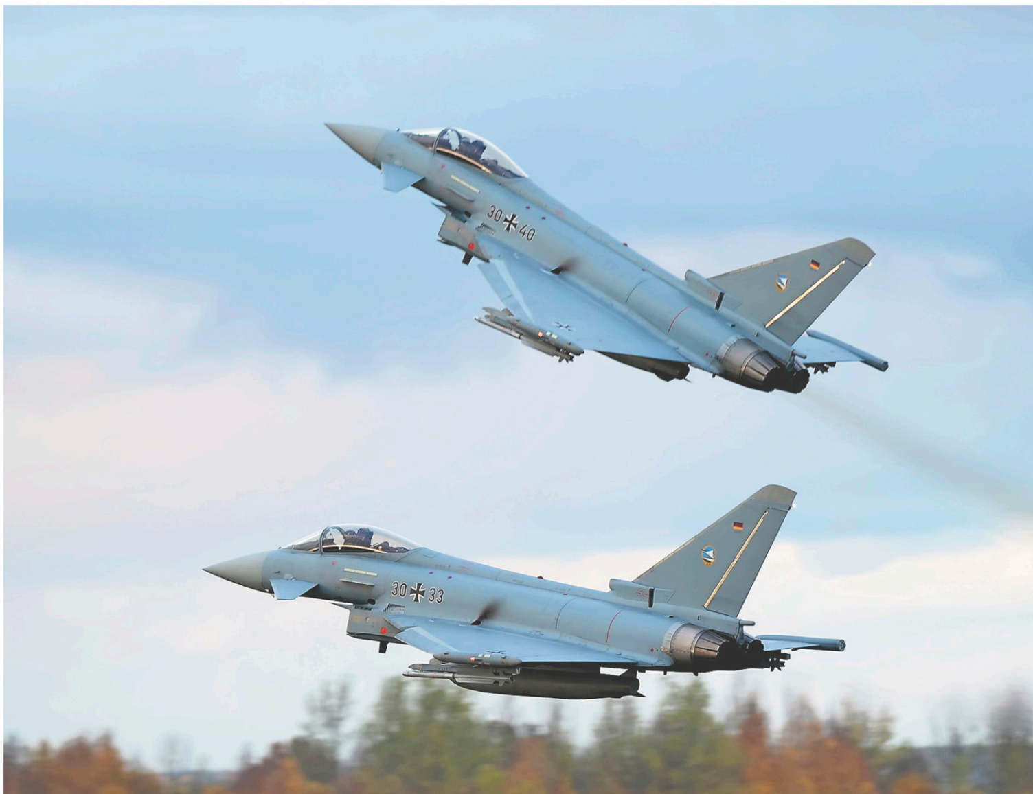
L'Autriche, l'Arabie saoudite, Oman, le Koweït et l'Italie ont déjà obtenu ou commandé des appareils Eurofighter Typhoon d'Airbus.