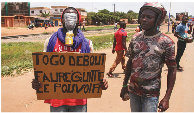
MATTEO FRASCHINI KOFFI AGENCE FRANCE-PRESSE «Togo debout, Faure quitte le pouvoir», peut-on lire sur l'affiche d'un manifestant contre le pouvoir, dans les rues de Lomé.