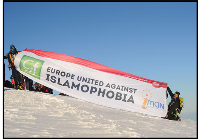
Une banderolle contre l'islamophobie au sommet du Mont-Blanc.

C'est le cas en France, depuis 2003, de la Commission nationale consultative des droits de l'homme (CNCDH) et du Mouvement contre le racisme et pour l'amitié entre les peuples (MRAP). L'usage du terme n'est pourtant pas encore tout à fait admis par tous, comme si la confirmation de sa réalité (par exemple le fait qu'en mars 2013, une rumeur sur deux sur le web serait islamophobe) achoppait sur un problème de terminologie, de définition et de délimitation de ce qu'il recouvre précisément.