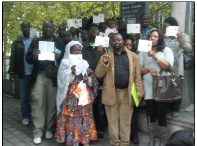
Devant la préfecture de Bobigny 23 octobre 2009

La France métropolitaine et les territoires ultramarins compteraient aujourd'hui quatre-vingt-dix mille Haïtiennes et Haïtiens 2 , dont la moitié probablement en situation irrégulière. La majeure partie est établie dans les départements d'outre-mer : Guyane, Guadeloupe Martinique et Saint-Martin. La diversité et l'éloignement géographique font qu'il est difficile de mesurer précisément la migration haïtienne vers la France. Néanmoins, une grande majorité des membres de la diaspora haïtienne en France sont soumis à un même écueil au cours de leurs démarches administratives: leur état civil.