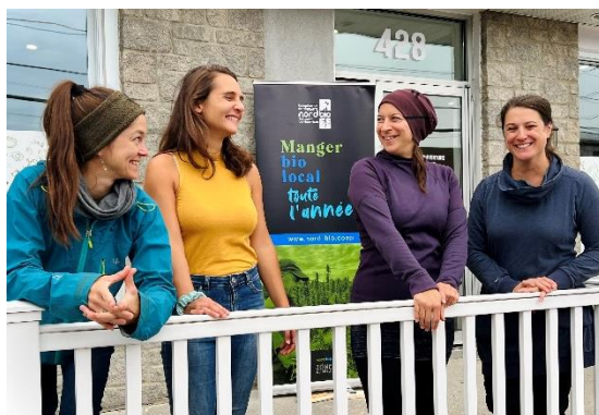
L'équipe de la coopérative NORD-Bio