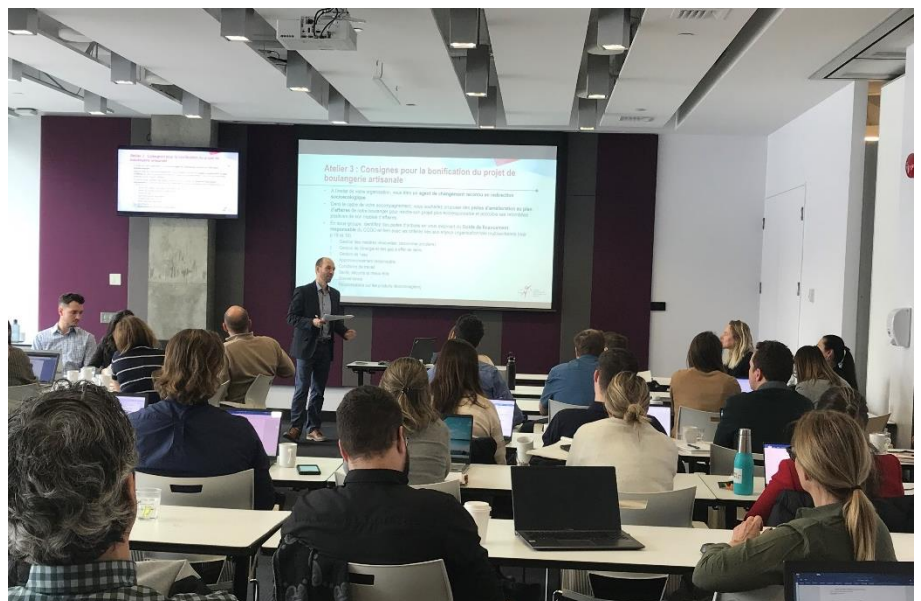
Journée de formation sur le développement durable dans le cadre du programme de formation « Développement économique urbain : dynamique et enjeux » destiné aux conseillers du Réseau PME MTL, en collaboration avec l'Association des professionnels de développement économique du Québec (APDEQ)

SADC Lac-Saint-Jean Ouest et Développement économique Alma Lac-Saint-Jean / Accompagnement dans une démarche de financement durable dans le cadre de PME Durable 02