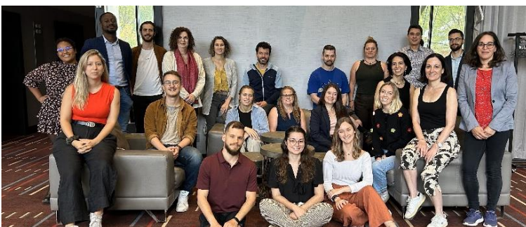
Réseau de conseillers lors de la rencontre annuelle du 3 au 6 octobre

Le succès de cette année est également attribuable au travail colossal du réseau de conseillers pour la promotion du Fonds Écoleader et des quelques 145 autres programmes d'aide financière disponibles au Québec pour concrétiser des projets d'écoresponsabilité. Le CQDD a offert un soutien continu au réseau dont il a la responsabilité de l'animation, en plus de la gestion des répertoires.