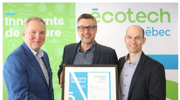
Prix innovant de nature d'Écotech Québec

306 entreprises du SLSJ informées // 12 projets déposés au Fonds Écoleader // 8 projets financés // 391 031 $ octroyés à des projets et des entreprises du SLSJ