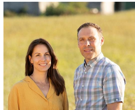
Fondateurs de la Ferme Tournevent