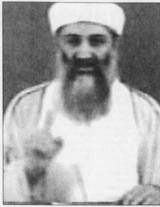
Oussama ben Laden dans sa dernière apparition vidéo, diffusée par al-Jazira.

Tout se passe, en effet, comme si la menace islamiste avait remplacé l'ennemi communiste d'hier, et qu'une même stratégie devait y être appliquée, soit la conclusion d'alliance avec quiconque se déclare hostile au terrorisme. On sait déjà au Canada que la lutte au terrorisme y entraîne des injustices. Ailleurs, ce