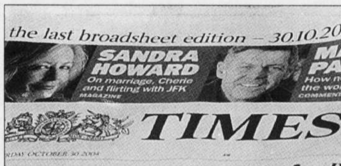
La dernière édition grand format du Times.