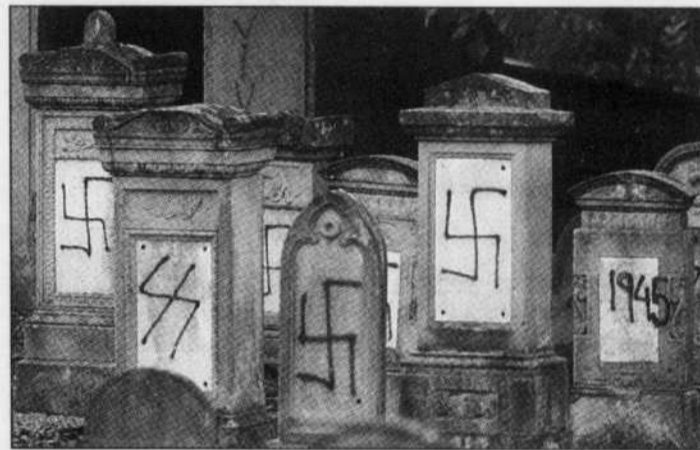
Ce sont les tombes les plus anciennes, des stèles en grès, qui ont été couvertes par des croix gammées au cimetière de Brumath, près de Strasbourg.