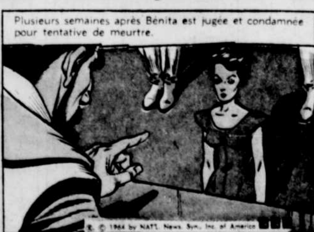
Plusieurs semaines après Benita est jugée et condamnée pour tentative de meurtre.