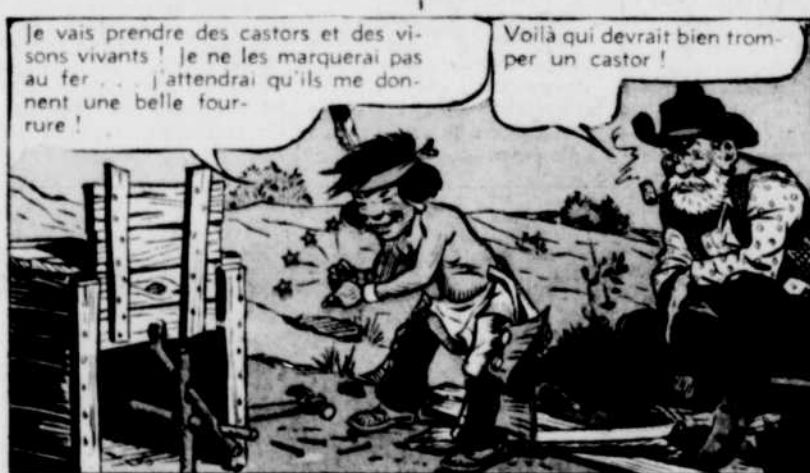
Je vais prendre des castors et des visons vivants! Je ne les marquerai pas au fer... j'attendrai qu'ils me donnent une belle fourrure!