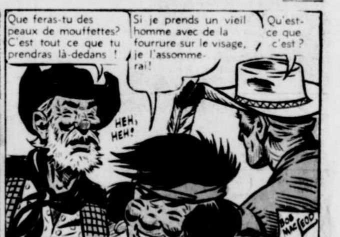
Que feras-tu des peaux de mouffettes? C'est tout ce que tu prendras là-dedans!