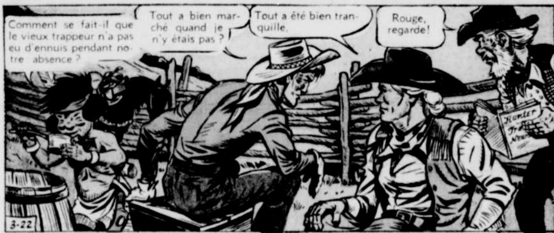
Comment se fait-il que le vieux trappeur n'a pas eu d'ennuis pendant notre absence?