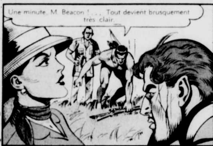
Une minute, M. Beacon!... Tout devient brusquement très clair.