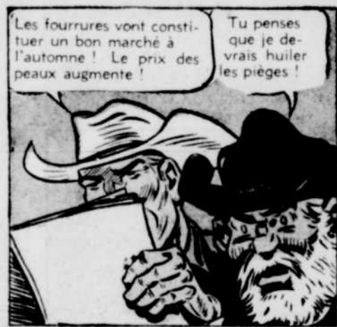
Les fourrures vont constituer un bon marché à l'automne! Le prix des peaux augmente!