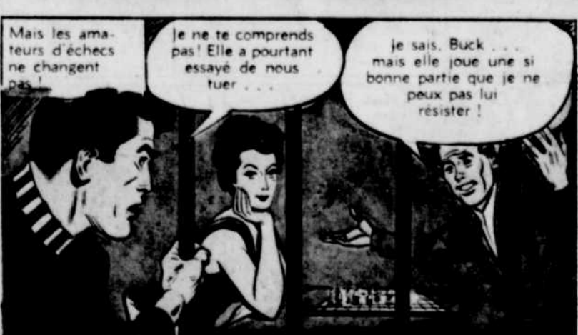
Mais les amateurs d'échecs ne changent pas!