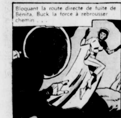
Bloquant la route directe de fuite de Benita, Buck la force à rebrousser chemin...