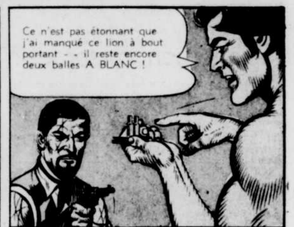
Ce n'est pas étonnant que j'ai manqué ce lion à bout portant - il reste encore deux balles A BLANC!