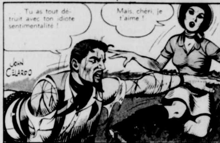
Tu as tout détruit avec ton idiote sentimentalité!