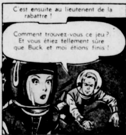
C'est ensuite au lieutenant de la rabattre!