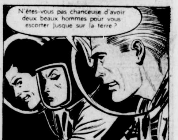
N'êtes-vous pas chanceuse d'avoir deux beaux hommes pour vous escorter jusque sur la terre?