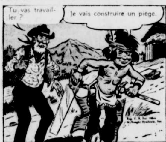
Tu vas travailler?