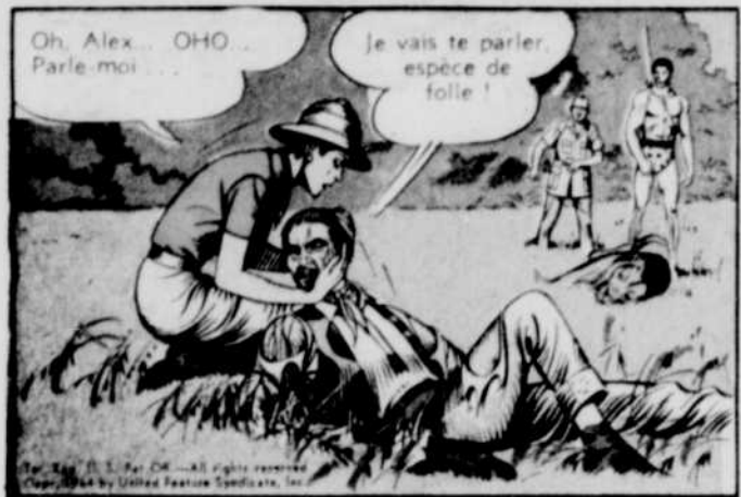
Oh, Alex... OHO... Parle-moi...