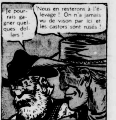
Je pourrais gagner quelques dollars!