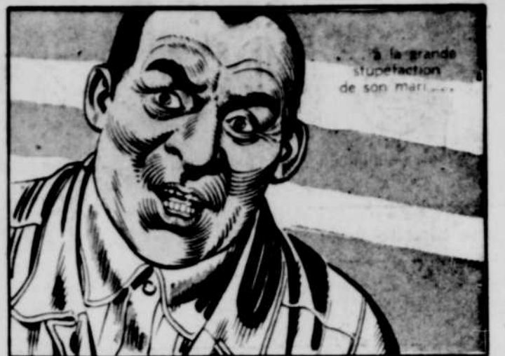
à la grande stupefaction de son mari...