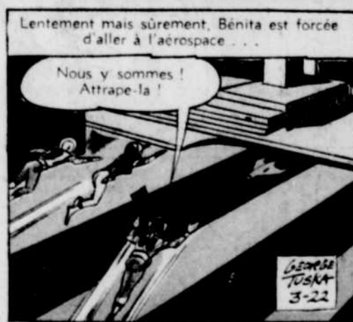
Lentement mais sûrement, Benita est forcée d'aller à l'aérospace...