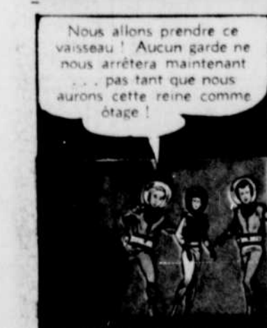
Nous allons prendre ce vaisseau! Aucun garde ne nous arrêtera maintenant... pas tant que nous aurons cette reine comme otage!