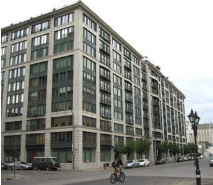
Édifice résidentiel 1 McGill

Parmi les secteurs où le retour sur l'investissement à presque doublé depuis les 10 dernières années à Montréal, on remarque l'immobilier et en particulier celui des condominiums.