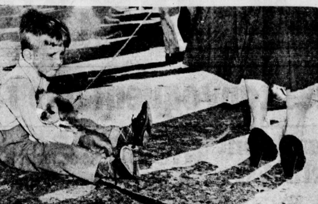
LA POLITIQUE NE L'INTERESSE PAS ENCORE! — Pendant que sa mère est attentive au cortège du Premier Ministre Saint-Laurent, de passage à Elora, ce petit Canadien d'Ontario en profite pour se reposer et... offrir la même chose à son petit ami à quatre patins.

AUJOURD'HUI DEVENEZ MEMBRE DE L'ENTRAIDE IMMOBILIERE LAURENTIENNE DEMAIN VOUS POSSEDEREZ VOTRE FOYER 1344 est, Sherbrooke, Montréal Tél. AM. 3698