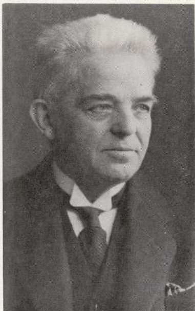
Carl NIELSEN (1865-1931) à quatorze ans et quelques années avant sa mort at fourteen and in later years