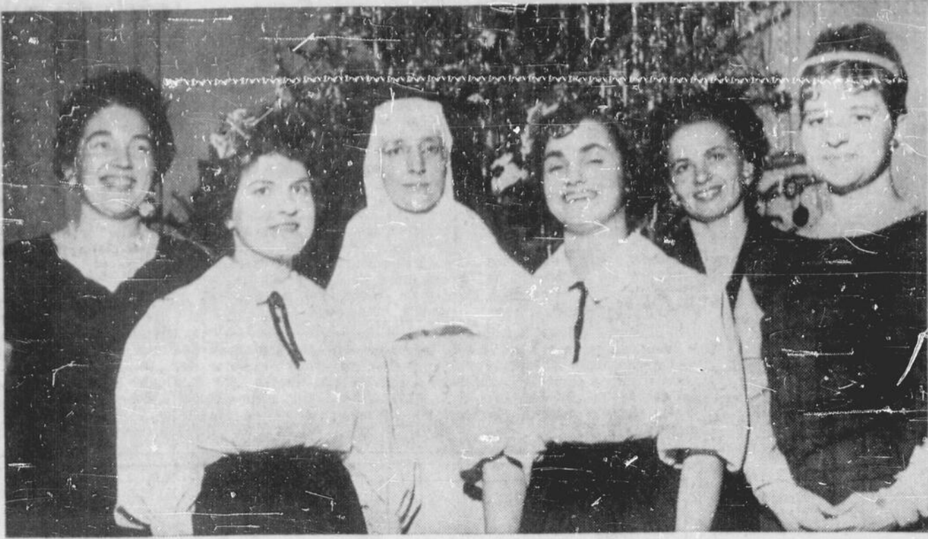
CONCERT ANNUEL AU FOYER BON PASTEUR — Le dernier concert annuel au Foyer du Bon Pasteur était donné le 10 janvier, et tous les artistes ont rendu avec brio leur numéro. Il y eut musique populaire et western, chant d'opéra, accordéon