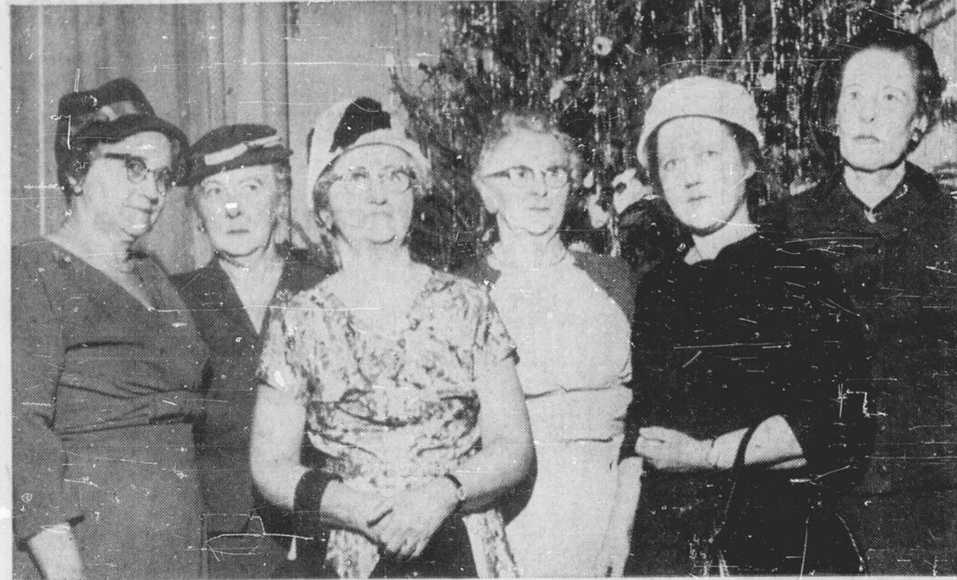
LES AUXILIAIRES DU FOYER DU BON PASTEUR — Une fois par année, les dames auxiliaires du Foyer du Bon Pasteur de Sudbury organisent une soirée-concert dans la salle de récréation de l'institution. Un bon nombre de personnes assistent à ces concerts qui sont suivis du défilé de l'arbre de Noël. Des cadeaux et bonbons sont donnés à chacune des jeunes filles qui s'y trouvent par les dames auxiliaires. Nous