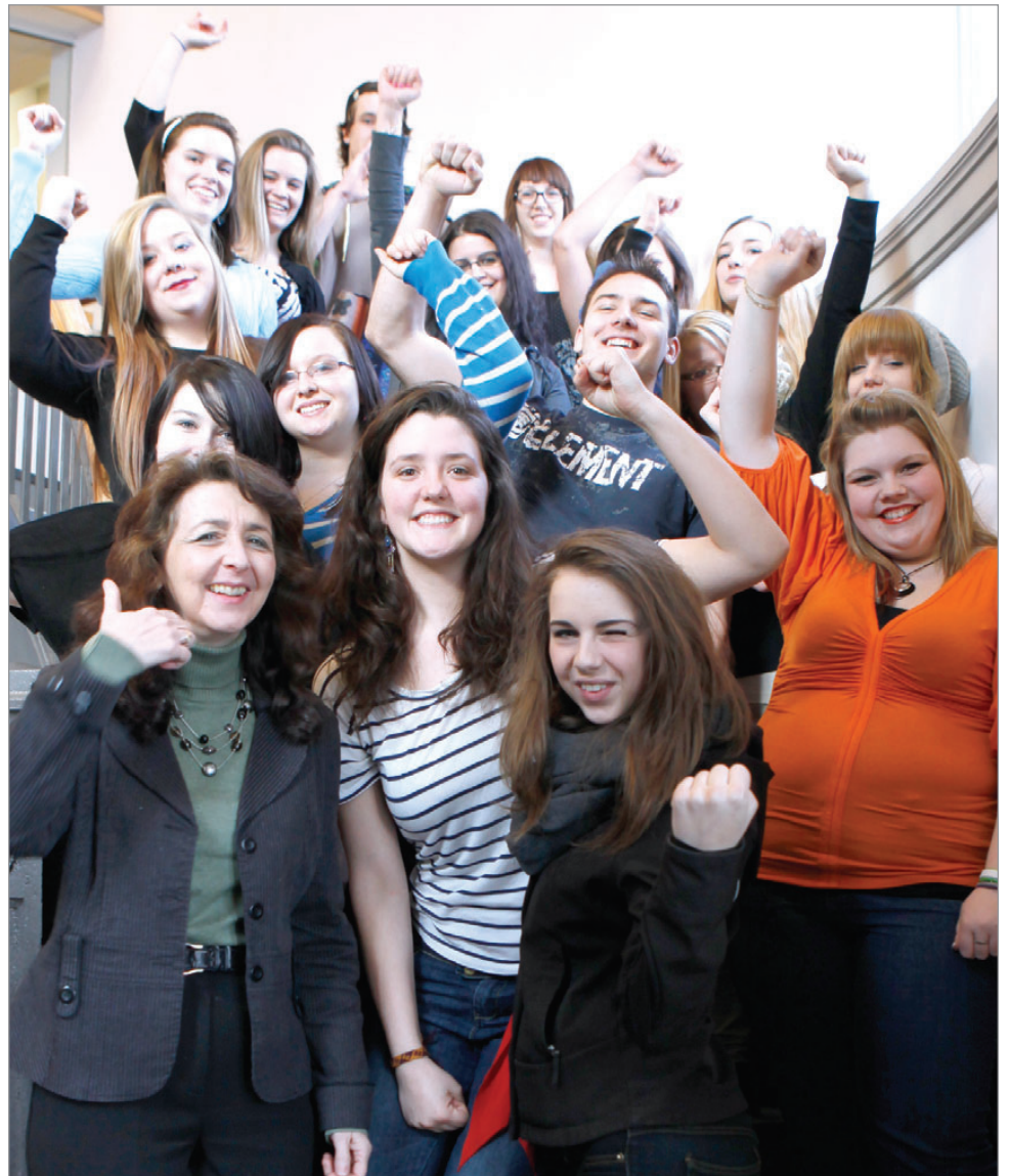
Les étudiants victorieux qui ont tous réussi leur épreuve ministérielle de littérature anglaise.

* Offre valide pour 3 mois. Par la suite, le tarif passera à 6,95 $. Les taxes sont incluses. Aucun remboursement pendant la période promotionnelle.