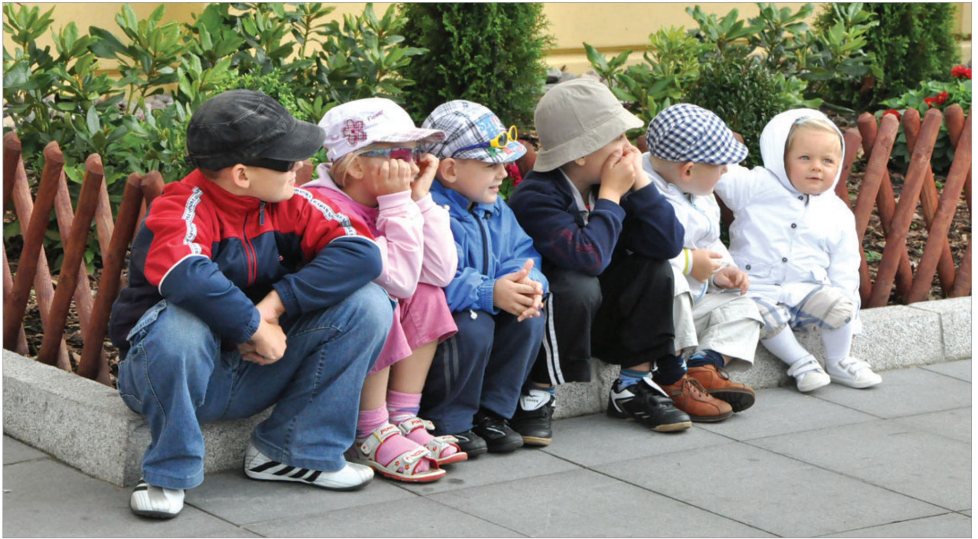
La Gaspésie-Iles-de-la-Madeleine bénéficiera de 252 nouvelles places en service de garde d'ici la fin décembre 2016