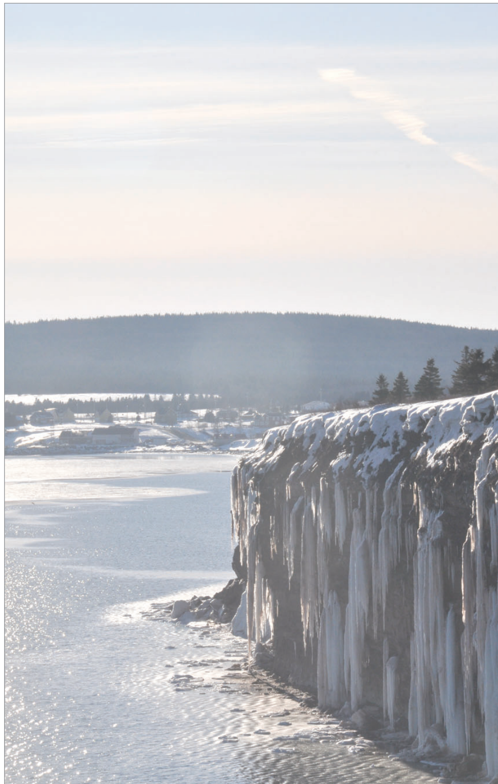
La qualité de vie peut rimer avec un milieu, avec ce qui s'y trouve, avec ce qu'on y vit... Voici ce qu'en pensent les fans du Havre sur Facebook.