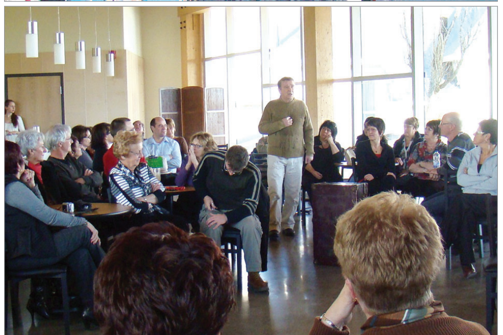
Le Centre culturel de Paspébiac offre de multiples possibilités d'événements.