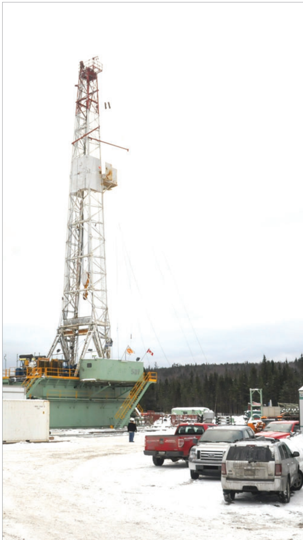
André Proulx, lors de son allocution au Forum stratégique sur les ressources naturelles de Montréal.

Au moment de publier, le maire de Gaspé n'avait émis aucun commentaire.