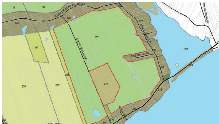
Zone 535R3 et Zone 536R1