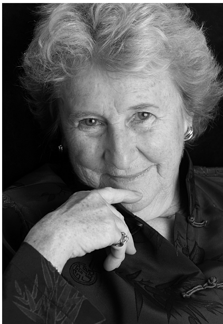
La dramaturge Antonine Maillet habite Montréal depuis plus de 40 ans.

Mme Maillet, qui a célébré en mai dernier ses 82 printemps, ajoute qu'à son avis Montréal est l'une des métropoles les plus culturellement effervescentes qu'elle a eu le pri-