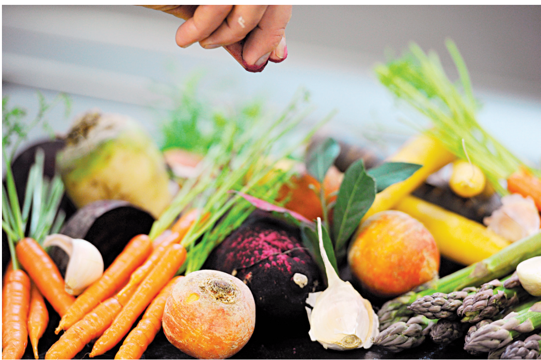
La stratégie de Centraide, rapporte sa directrice, consiste par exemple à inviter les personnes démunies à participer à des cuisines collectives, au lieu de leur donner des sacs de provisions.

La p.-d.g. de Centraide se fait fort de souligner qu'en vérité, si elle s'est vu attribuer cet honneur, c'est avant tout en raison de l'œuvre que poursuit son organisme dans la collectivité montréalaise. «En 2011, ça faisait déjà dix ans que j'étais à Centraide, dit-elle, et c'est pour cela que j'ai été désignée «Grande Montréalaise». En fait, ce n'est pas tant