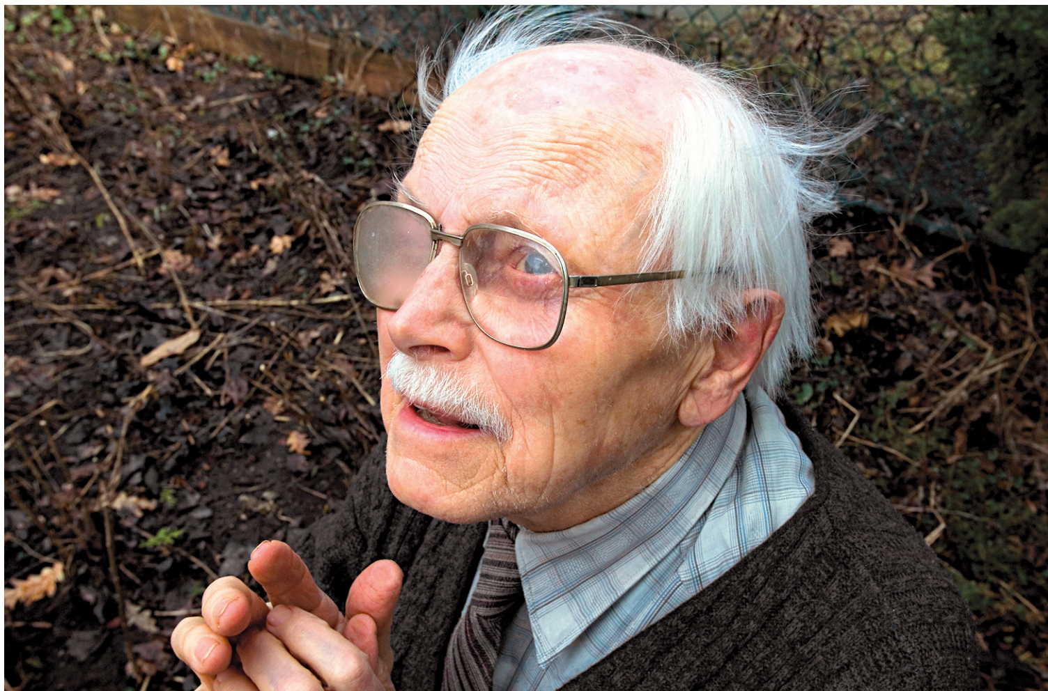
Aujourd'hui, Frédéric Back a quelque peu rangé ses crayons et ses pinceaux pour dédier ses mains au service de son épouse, paralysée depuis près de cinq ans.

Lui-même, il a planté des milliers d'arbres. « Je ne voulais pas simplement être un théoricien, » répète-t-il. L'artiste et l'écologiste demeurent indissociables. Dès son enfance, en Alsace, il est « ému par la souffrance, les guerres, le mal qu'on fait aux animaux, » en croquant de ses crayons la pollution des cours d'eau et la cruauté envers les chevaux. « Il faut réagir. J'ai fait