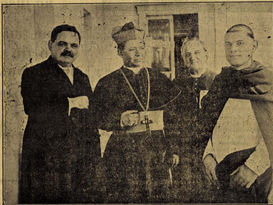
L'HON. M. GOUIN, Premier Ministre.

Les Principaux Personnages Presents