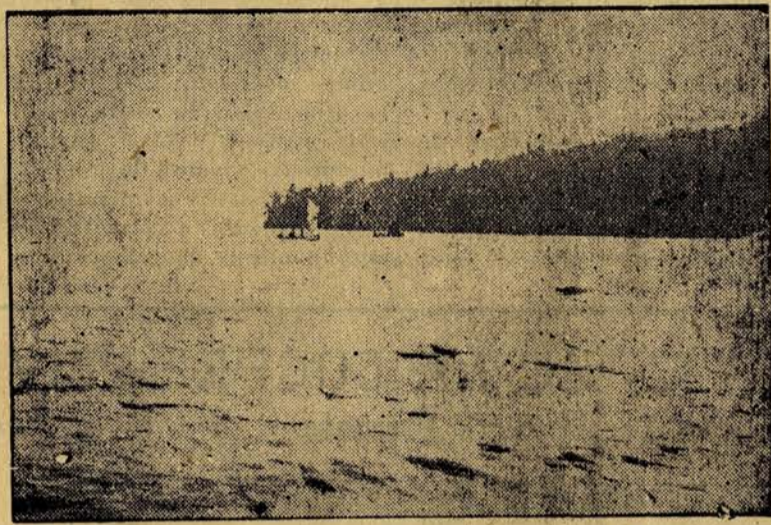
S. IGNACE DE NOMININGUE : La longue et belle presqu'île dite Pointe des Pères, dans le grand lac Nomingue.

—L'autre semaine, à S. Pascal, comté de Kamouraska, plusieurs ministres et hommes politiques honoraient de leur présence la clôture des travaux annuels de l'Ecole