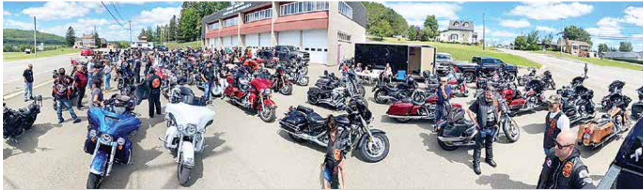
Lors de la «Ride à Bryan» 2020, on comptait près d'une centaine de motocyclistes. Photo contribution

«La pandémie ne nous a pas empêché d'organiser cette randonnée, mais nous avons fait en sorte de respecter les normes et la distanciation sociales. Au total, on comptait 108 inscriptions ainsi que 96 motocyclistes. Tout s'est vraiment bien passé. Habituellement, le nombre de