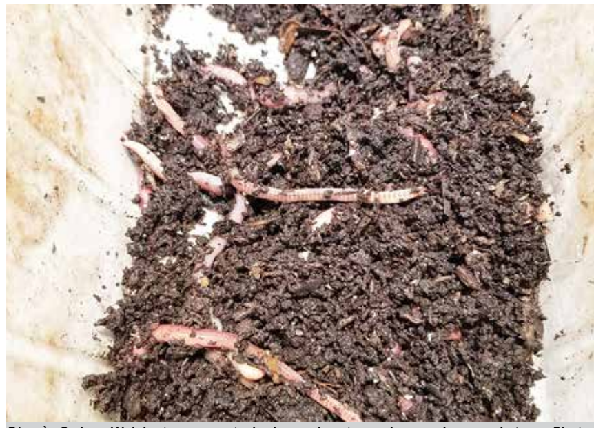
D'après Sydney Walsh et ses parents, la demande est grande pour des vers de terre. Photo contribution

À l'heure actuelle, Sydney Walsh possède de 20 à 30 contenants de plastique à l'intérieur desquels on retrouve de la