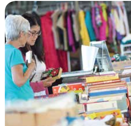
La gigantesque vente-débarras annuelle est devenue une excellente façon pour les Filles d'Isabelle d'amasser des sous pour appuyer la communauté.

«Plusieurs bénévoles se greffent aux Filles d'Isabelle et souvent, ce sont des gens qui sont venus magasiner et qui souhaitent donner un coup de pouce l'année suivante. De plus, beaucoup de gens nous apportent du matériel et nous voyons vraiment l'impact positif de cette gigantesque vente-débarras annuelle sur la communauté.»