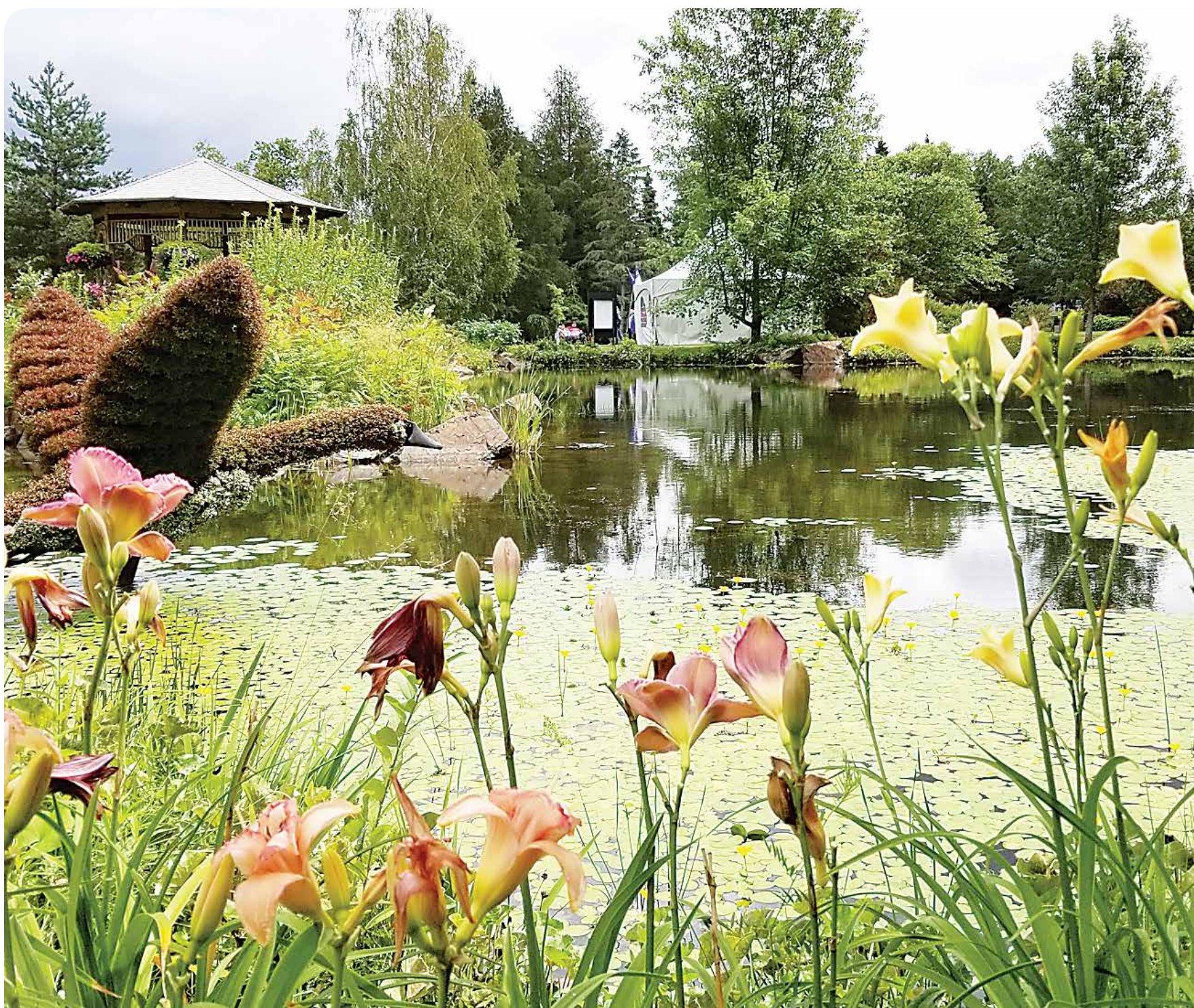
Le Jardin botanique du Nouveau-Brunswick