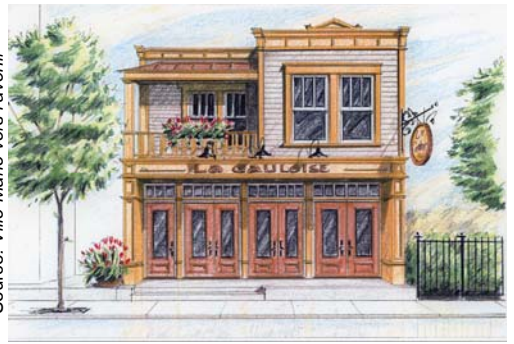
Plan de restauration de la façade de La Gauloise

Les travaux de restauration débuteront à l'été 2003.