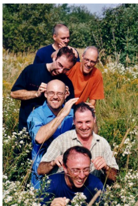
Abitibi Pure Laine

C'est dans une maison en bois rond typiquement québécoise que s'est fait l'enregistrement du premier disque du populaire groupe folklorique Abitibi Pure Laine. Question d'accoustique, à ce qu'il paraît! Toujours est-il que ce disque de musique traditionnelle arrive à point nommé pour le temps des fêtes. On prétend même qu'un reel live de 8 minutes présent sur le disque, risque d'envahir les partys de Noël familiaux aussi sûrement