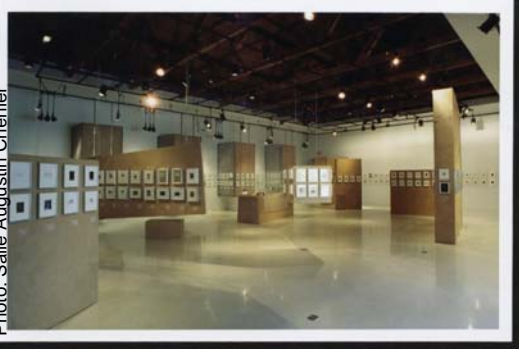
Biennale internationale d'art miniature

nale internationale d'art miniature de Ville-Marie et le Musée de la miniature de Montélimar en France.