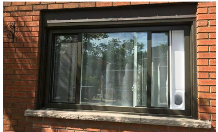
Rue Lambert (après)