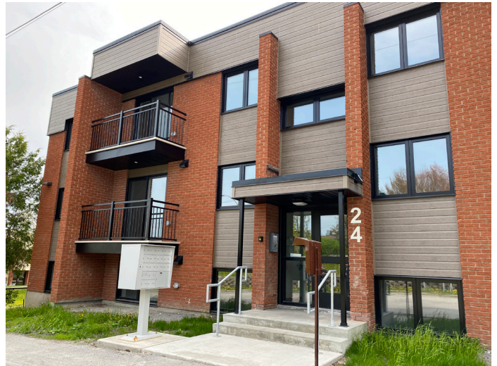
24, rue Arthur-Buies (après)

En 2022, le projet représentant le plus gros investissement est la phase 2 du projet de la rénovation du 24, rue Arthur-Buies, le coût des travaux s'élevant à 1 322 050 $. Suite à une investigation faite par des firmes professionnelles, l'OH de l'Outaouais a découvert plusieurs problématiques de construction qui auraient causé, à long terme, d'énormes dégâts mettant en danger la sécurité et la santé des locataires habitant l'immeuble.