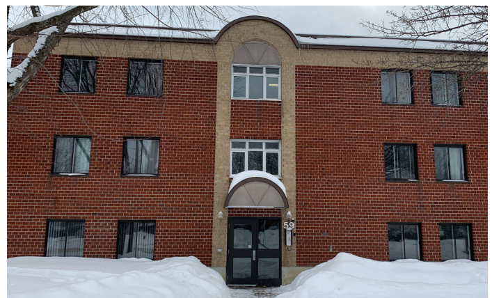
Rue O'Farrell (après)