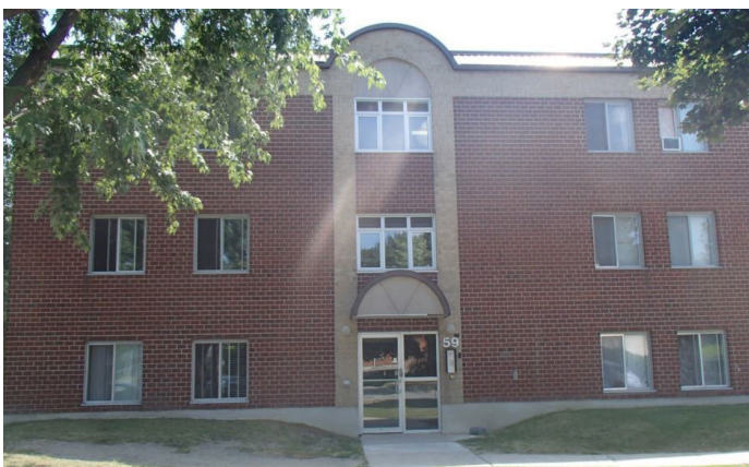
Rue O'Farrell (avant)