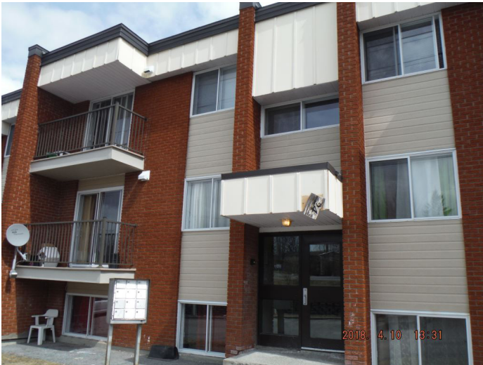
24, rue Arthur-Buies (avant)