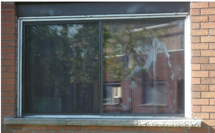
Rue Lambert (avant)

Le montant total d'investissement pour ce projet est de 1 226 580 $. Lorsque les portes, fenêtres et portes-patio atteignent leur durée de vie utile, l'OH de l'Outaouais les remplace afin d'augmenter l'efficacité énergétique des bâtiments et améliorer le confort des locataires qui y résident.