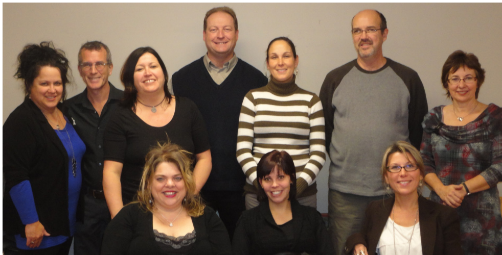
Le Comité curateur interdirection de 2012.