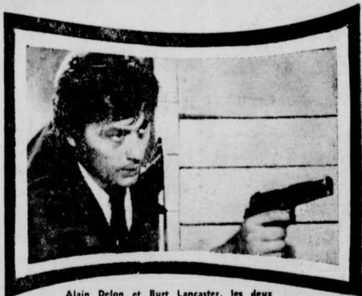
Alain Delon et Burt Lancaster, les deux principaux interprètes du film "Scorpio", présentement à l'affiche du cinéma CANADIEN.