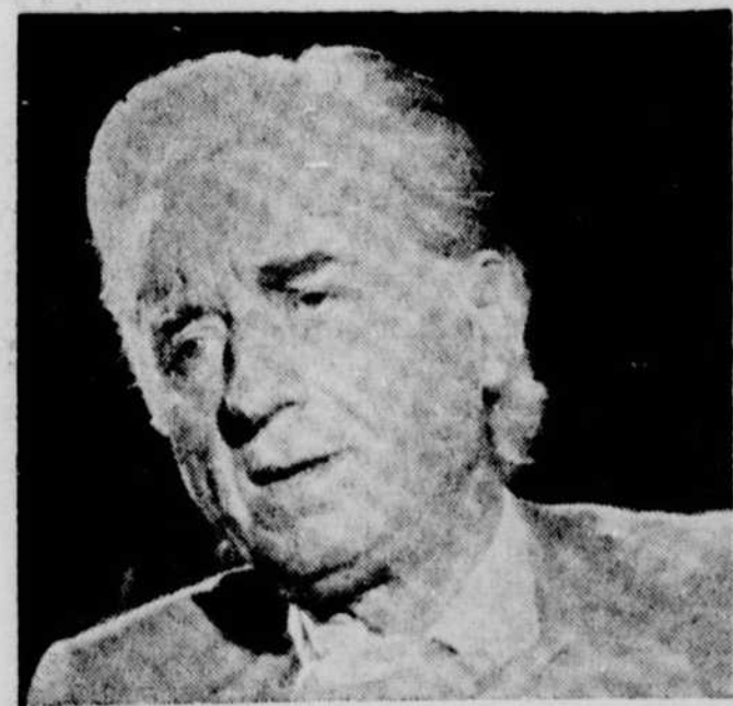
Le mardi, à 22h.00, écoutez les propos et confidences du comédien Claude Dauphin, à Radio-Canada.