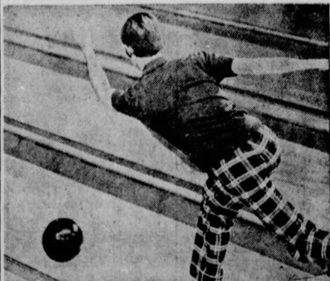
Abat ou trouée? Les vrais professionnels des quilles pourraient peut-être le prédire, en analysant le synchronisme du quilleur en action.