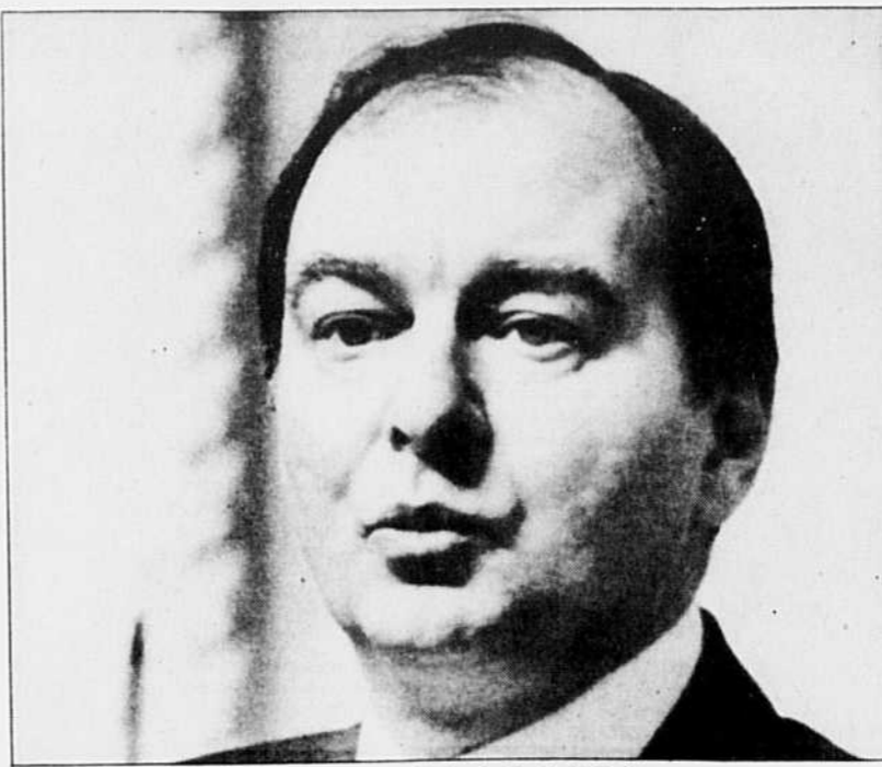
Gilles Rocheleau, député du Bloc québécois de Hull-Aylmer.

■ parce que, pour des milliers de fonctionnaires résidant dans l'Outaouais québécois, l'habitude des contacts quotidiens avec les ministères et organismes fédéraux, la connaissance des mécanismes de fonctionnement du gouvernement fédéral et la capacité de travailler et