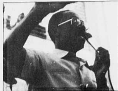
Le père Aristide, un sauveur ?

nombre de personnes, au fil des tournées triomphales du « prophète ». « Une certaine conscience naïve existe dans la société haïtienne. C'est normal. C'est le résultat de toutes ces années de dictature. Je m'attendais à ce cas de figure du candidat-sauveur », dit M. Serge Gilles, leader du PANPRA (parti socialiste), premier ministre potentiel allié à la candidature Bazin, qui dénonce « la démagogie et la mystification du camp Aristide ».