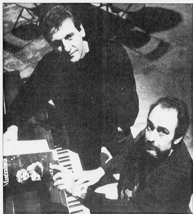
Alain Boublil pianiste et Claude-Michel Schönberg, le compositeur, les deux auteurs de ce phénoménal succès.