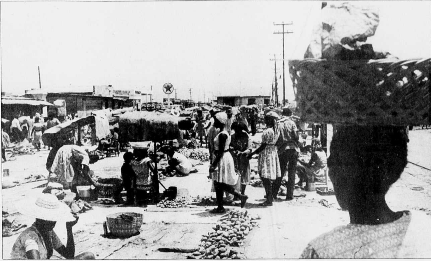
Bidonville de Port-au-Prince. Le retour des masses écrasées au-devant de la scène politique peut-il se faire sans dérapages ?

Table de gauche, un jeune mulâtre BCBG prêche au contraire pour la candidature Aristide, expliquant qu'il s'agit de « la dernière chance d'Haïti, pour attaquer de front la pourriture et la corruption ». Il évoque « la campagne maladroite » de Marc Bazin, « un technocrate bien intentionné