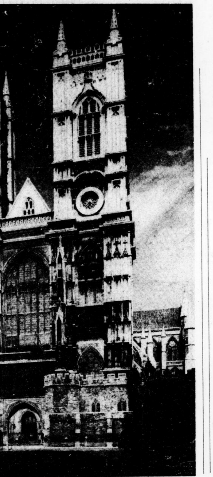
La Reine ELIZABETH sera couronnée aujourd'hui dans cette abbaye historique où l'auront précédée les autres souverains britanniques.