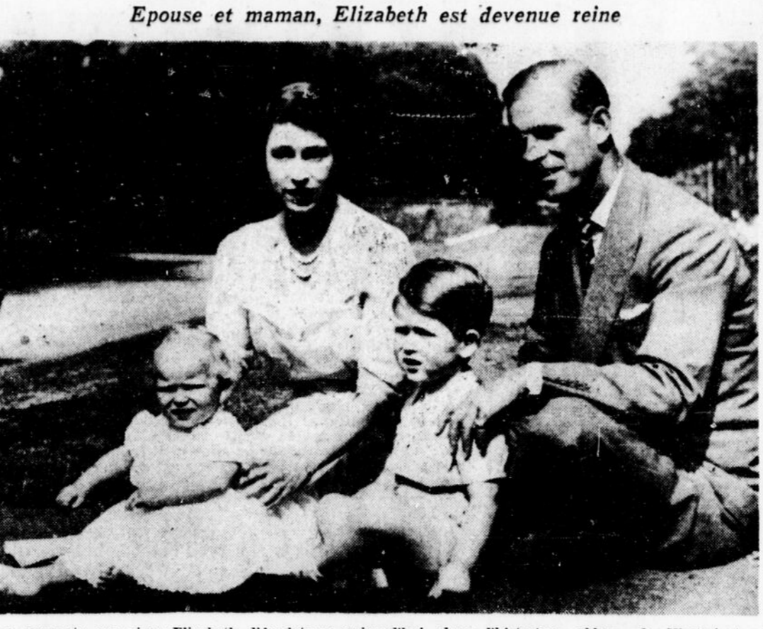
Les moments que vivra Elizabeth d'Angleterre aujourd'hui, dans l'histoire abbaye de Westminster, seront bien différents de cette scène paisible qui se déroulait il y a déjà deux ans, dans les jardins de Clarence House, alors que la princesse Elizabeth s'accordait une heure de détente en compagnie de son époux, le duc d'Edimbourg, et de ses enfants, Charles et Anne.

Une nouvelle descendante des Habsbourg est née Wuerzburg, Allemagne (PA) Une fille est née hier, à la clinique universitaire de Wuerzburg, à l'épouse de l'archiduc Otto de Habsbourg, prétendant au trône d'Autriche. La jeune femme, âgée de vingt-huit ans était la princesse allemande Regina de Saxe-Meiningen. L'archiduc Otto et la princesse sont mariés à Nancy, en France, en mai 1951.