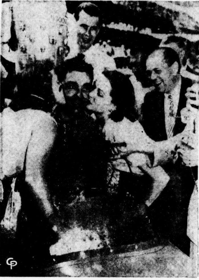
La figure couverte de sueurs, BILL VUKOVICH, de Fresno, Californie, reçoit ici un double prix pour sa magnifique victoire au marathon de 500 milles d'Indianapolis: un baiser de son épouse, à gauche, et un autre de l'actrice de cinéma Jane Greer, à droite. En arrière, on peut voir le trophée emblématique. Vukovich a établi un record en triomphant dans 198 des 200 étapes que comprenait la course. Cela lui a rapporté la jolie somme de $23,200 en plus des $65,000 décernés au vainqueur. L'an dernier, il avait gardé la tête du peloton durant la majeure partie de l'épreuve mais un trouble mécanique, 25 milles avant la fin, l'avait privé de la victoire.

à la seconde. L'an dernier, le che- va. Epigram rapporta $16,877, à son propriétaire. Plus de 50,000 amateurs sont at- tendus à la piste de Woodbine Park et le signal du départ sera donné à 4:45 heures p.m. (h.a.e.) Le record d'assistance pour le Queen's Plate est de 48,500 personnes et fut établi en 1948 quand Last Mark remporta la victoire dans le temps record de 1:52.