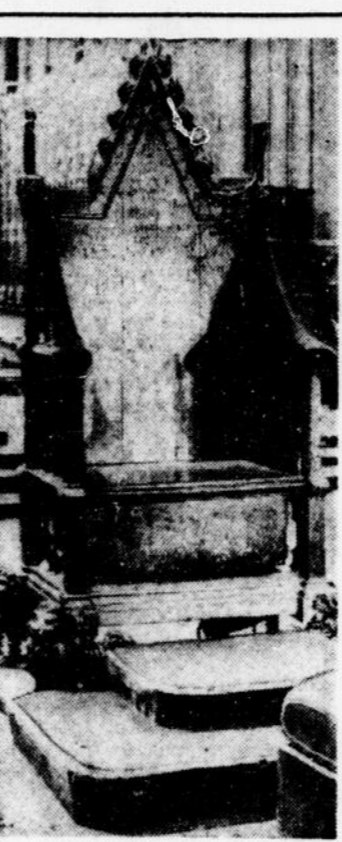
Le trône de la consécration

Le mercure descendit à 46 degrés, mais de bonnes couvertures, les danses de joie et le petit flacon tenaient chaud. D'aucuns improvisèrent des tentes pour se protéger contre la pluie. Les gens se sont peu souviens de la pluie, car ils y ont vu un bon augure pour le règne d'Elizabeth. D'ailleurs, cette pluie fut suivie d'une magnifique arc-en-ciel, dont les riches couleurs vinrent s'ajouter aux brillantes décorations de Londres.