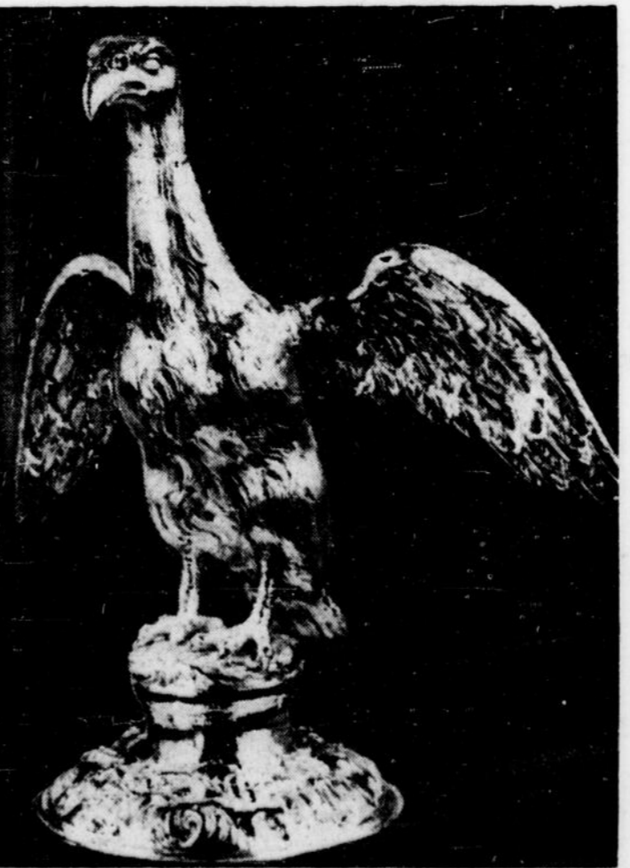
Dans l'Aigle Doré, le chrême secret