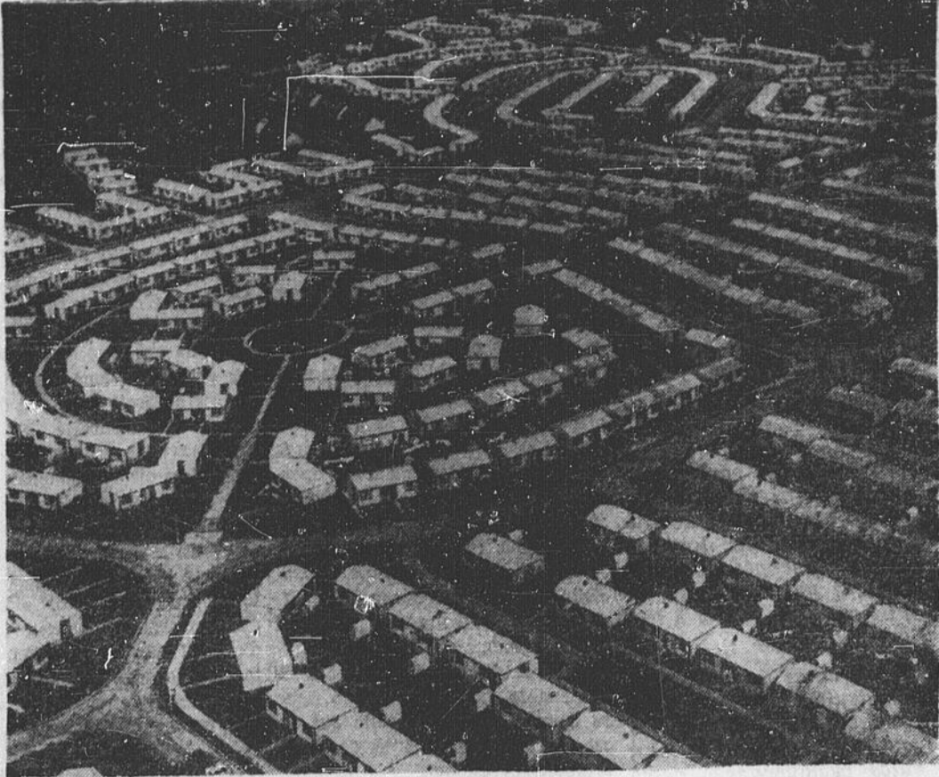
VILLAGE DE 711 MAISONS PREFABRIQUEES en Grande-Bretagne. C'est le plus gros du genre dans les Iles Britanniques; il est situé près de Yarmouth. La rivalité porte les occupants à embellir leurs terrains en y cultivant jardins et parterres.