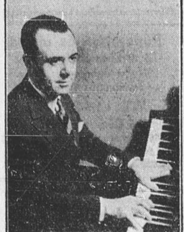
Le pianiste JOSE ITURBI s'embarquera bientôt pour la France où le gouvernement vient d'annoncer qu'il lui confèrera l'ordre de la Légion d'honneur.