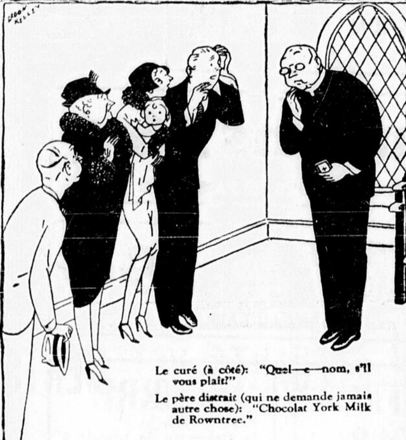
Le curé (à côté): "Quel nom, s'il vous plaît?" Le père distrait (qui ne demande jamais autre chose): "Chocolat York Milk de Rowntree."

QUEL nom distinctif pour l'enfant, pense le curé Jean, (mais, réellement, pas plus distinctif que la saveur du Chocolat York Milk de Rowntree). Naturellement, le bébé est le chéri de la maman, mais le York Milk de Rowntree est le favori de tout le monde. Bébé peut devenir premier ministre un jour—le York Milk est le choix de la nation aujourd'hui et chaque jour.