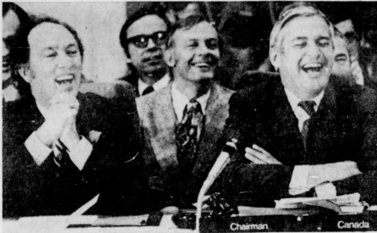
Ce n'est sûrement pas la situation économique mondiale qui a fait tant rire le premier ministre Trudeau, à gauche, et le ministre canadien des Finances, M. John Turner, hier, à l'ouverture de la conférence des ministres des Finances du Commonwealth, à Ottawa.

Quoi qu'il en soit, M. Masse abandonne la politique active pour deux ans et il aura amplement de temps en Afrique pour réfléchir sur son avenir.