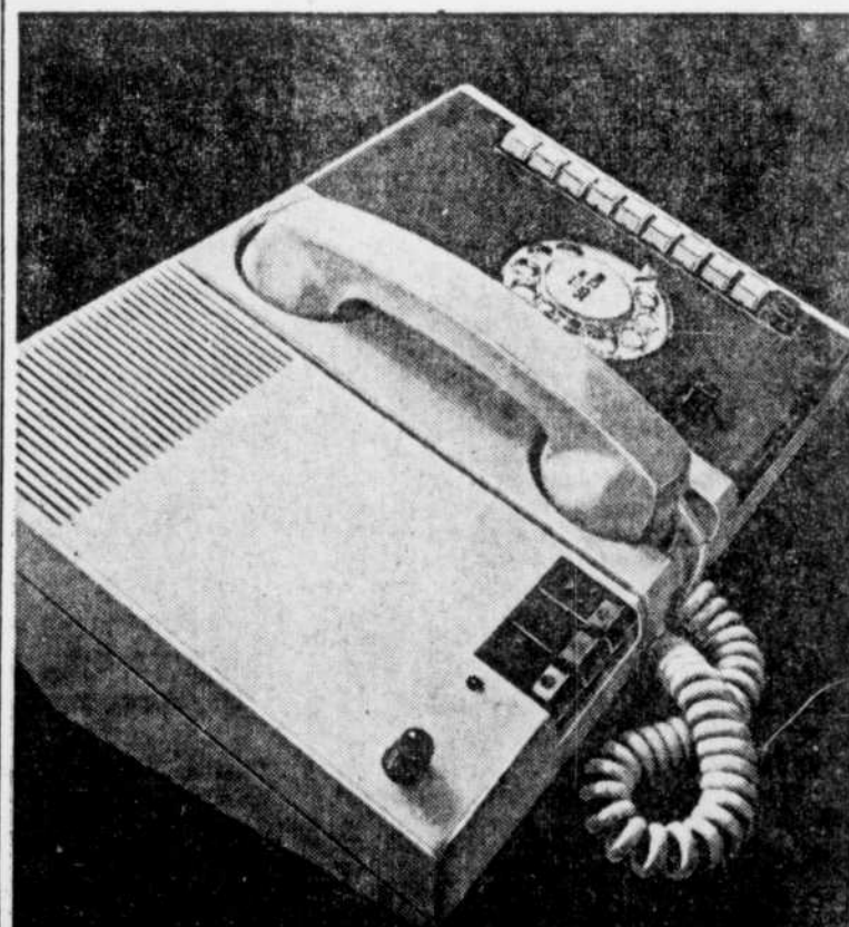
Logic "Mains libres"

UN BRIN DE PATIENCE SOVOP TOUTES NOS VEDETTES SERONT LA DEMAIN SOIR LE 27 □