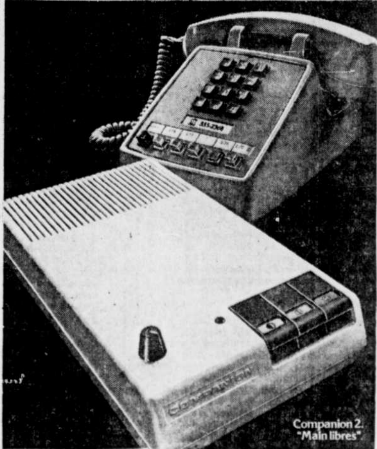
Companion 2 "Mains libres"