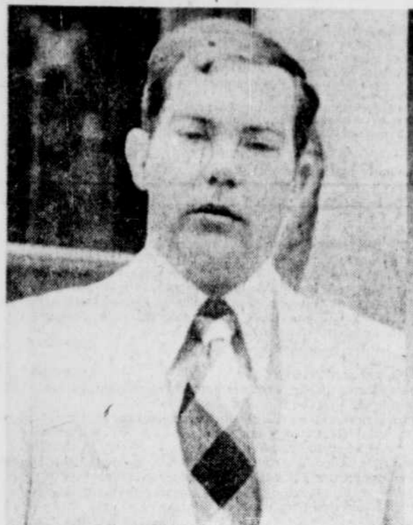
L'ancien lieutenant William Calley