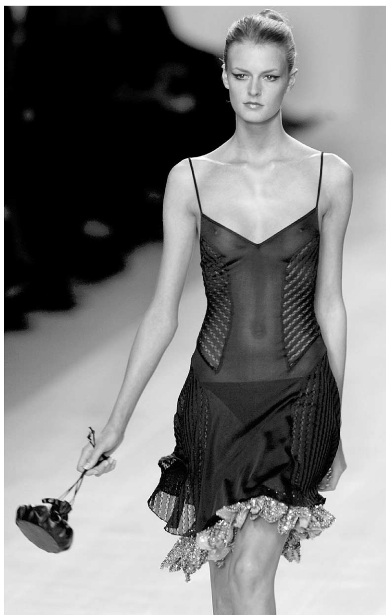
L'esprit lingerie descend dans la rue.

découpent le côté d'un pantalon, ornent un T-shirt, décorent un blouson. Les chaînes de métal sont partout : elles s'accrochent à la taille d'un pantalon, font office de ceinture ou se portent en long collier. Comme l'exige l'univers hard , le cuir et le noir s'imposent, mais avec quelques exceptions comme cette robe hyper-moulante rose fuchsia garnie d'oeillets de métal de Versace.