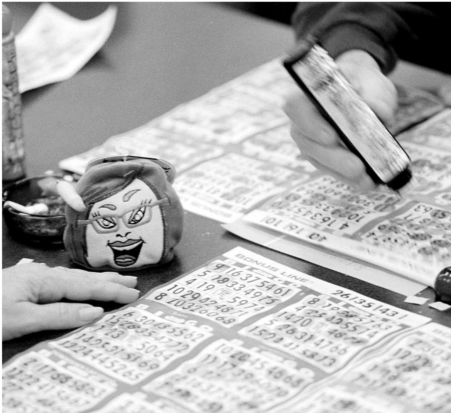
Le tampon encreur — gros feutre de couleur utilisé pour marquer les numéros qui sont débités à toute vitesse —, est l'outil suprême du joueur de bingo !

On ne nous explique cependant pas en quoi cette pratique pourrait améliorer le sort de la gent masculine, ni, d'ailleurs, qui au juste a envie d'adopter cette habitude pas très naturelle, ni particulièrement virile.