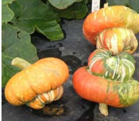
Courge de type Turban Turc à ne pas utiliser comme culture piège.

Bien que le Turban Turc fasse partie des Cucurbita maxima , celui-ci ne doit pas être utilisé en bordure, car il s'avère très sensible au flétrissement bactérien.