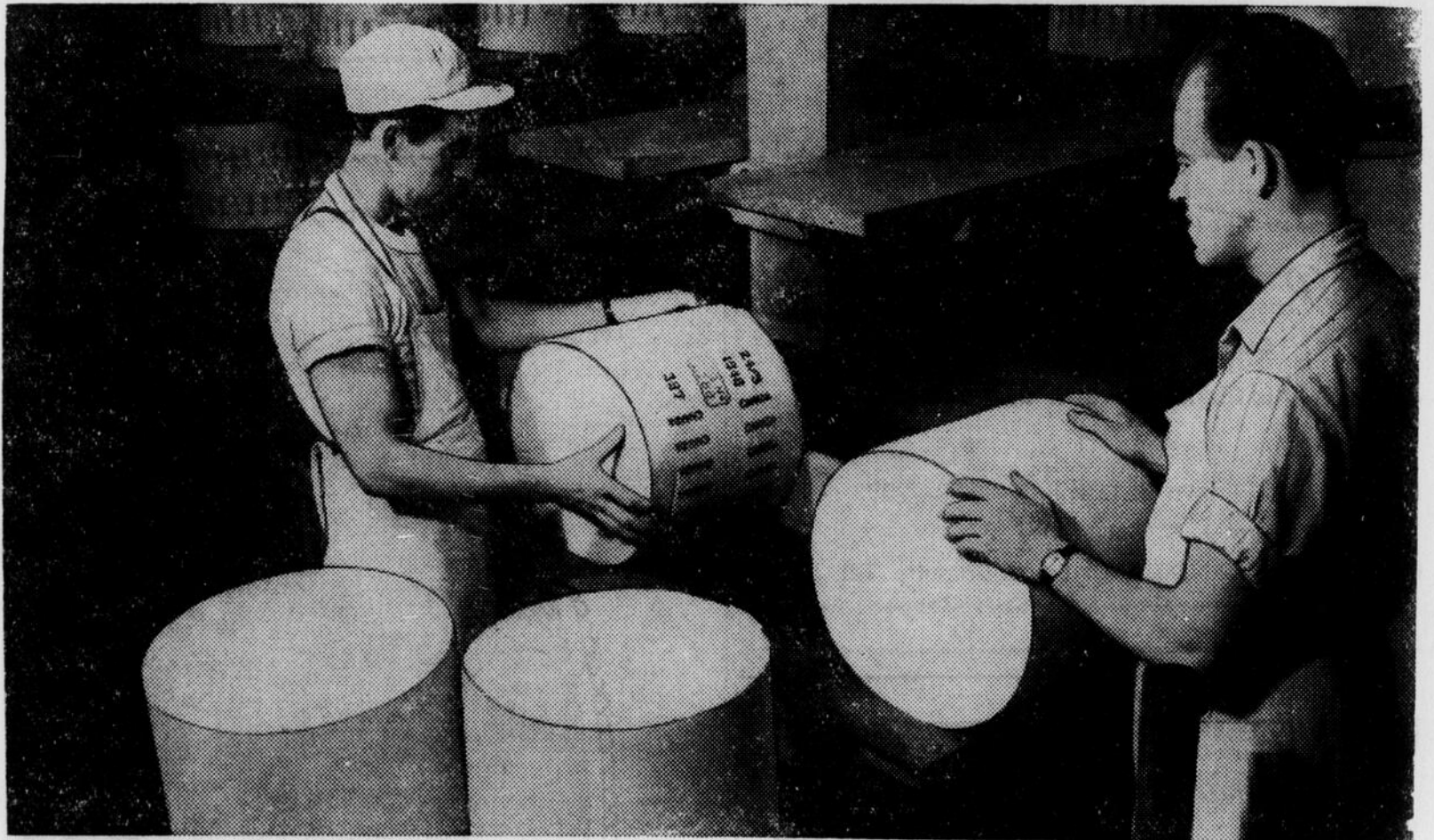
La fabrication du fromage