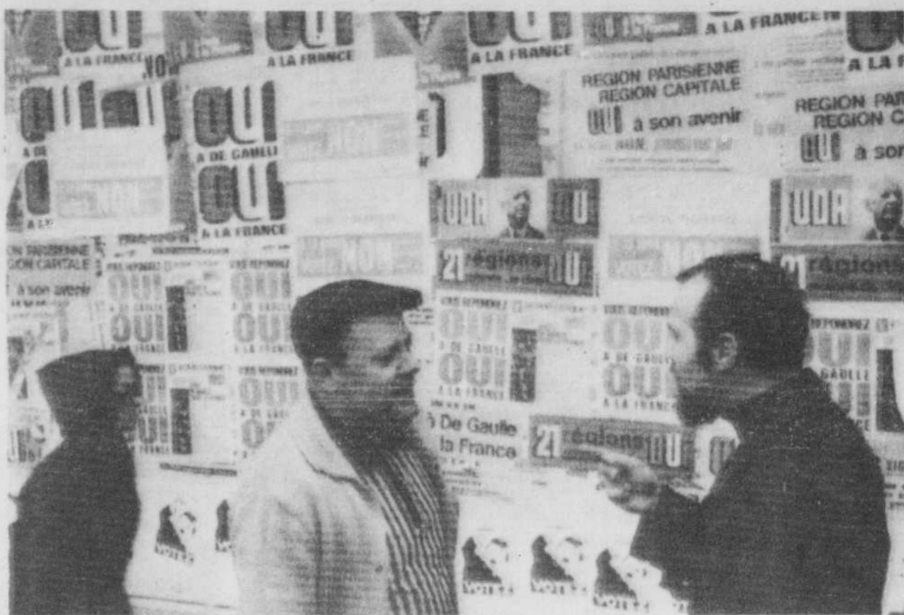
Le référendum de dimanche, on s'en doute, fait l'objet de la discussion qui anime ces deux chauffeurs de taxi parisiens. Le général de Gaulle a promis sa démission immédiate si les Français rejetaient ses propositions: décentralisation du pouvoir et diminution de l'importance du Sénat.

On trouvera en page 9 le texte intégral des 56 recommandations de la commission Prévost sur la sécurité judiciaire.