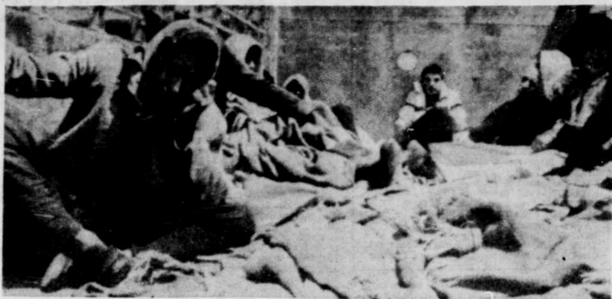
Des villageois chrétiens sont emportés en camion par des miliciens druzes, loin de la zone de batailles.