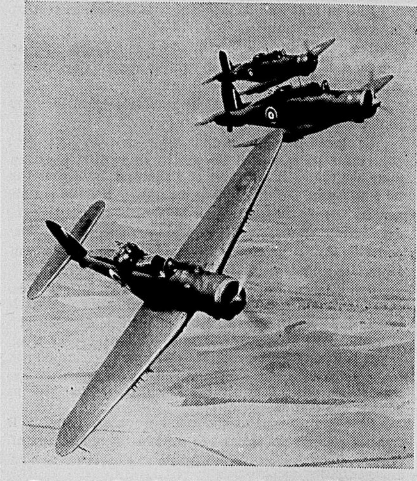
Trois avions de combat britanniques de marque Blackburn Roc volant en formation au-dessus de la Manche. Ces appareils, entièrement construits de métal, appartiennent à la Marine royale, et disposent de mitrailleuses ultra-rapides qui sont protégées par une tourelle fortement blindée.

dicateur, je prie ceux d'entre vous qui ont lu le chapitre indiqué de bien vouloir lever la main". Toutes les mains se lèvent. Un sourire passe sur les lèvres de l'orateur. "Très bien! dit-il. Je suis content de voir que j'ai exactement l'auditoire qu'il faut pour parler du mensonge: l'Evangelium selon saint Marc n'a que seize chapitres".