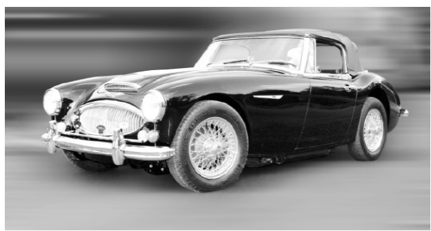
AUSTIN HEALY 1966

Au cours de votre visite au niveau 7, arrêtez-vous pour admirer plusieurs modèles exceptionnels de véhicules britanniques dans l'attraction spéciale 100% Anglaises. Cette attraction est présentée en collaboration avec le club automobile « Le Rendez-Vous des Anglaises », le plus grand club francophone de voitures anglaises au monde.