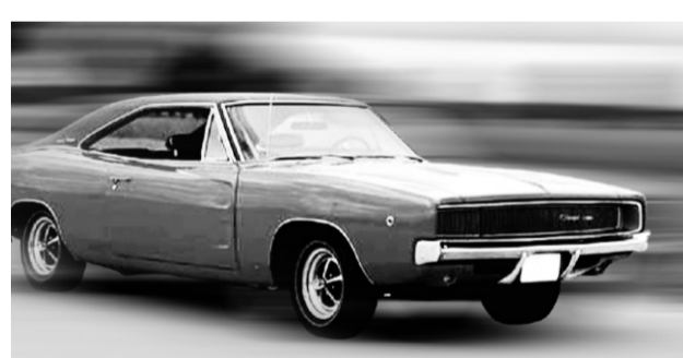
DODGE CHARGER 1968

Volkswagen Beetle 1968 et New Beetle 2008