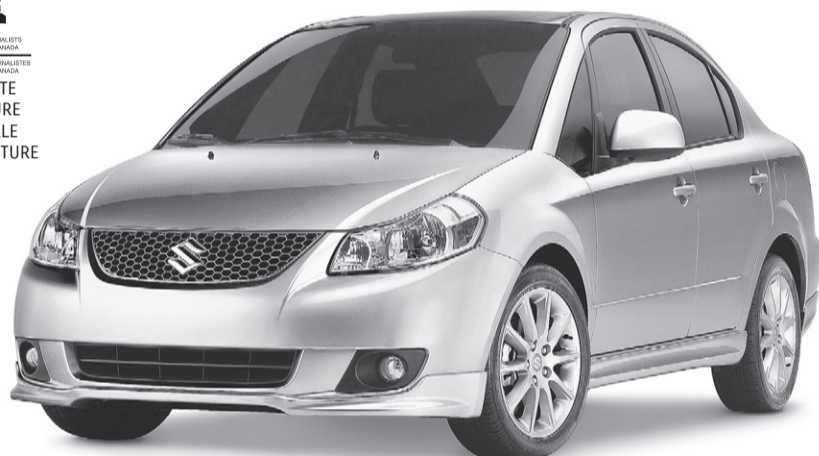
Modèle sport illustré

FINALISTE MEILLEURE NOUVELLE PETITE VOITURE 2008