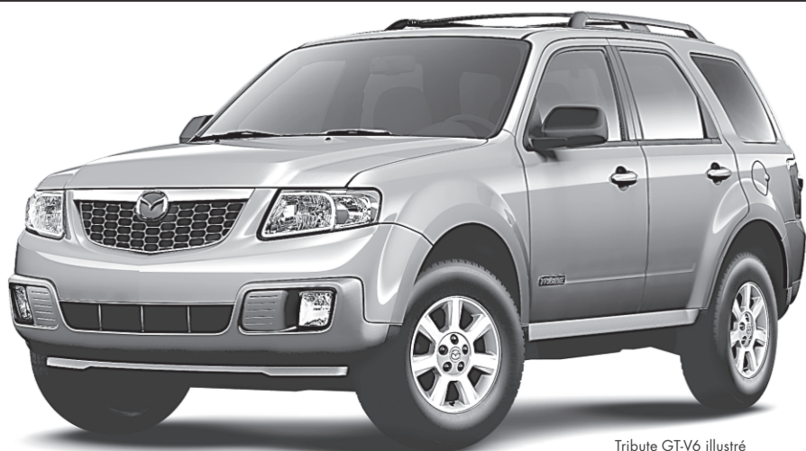
Tribute GT-V6 illustré