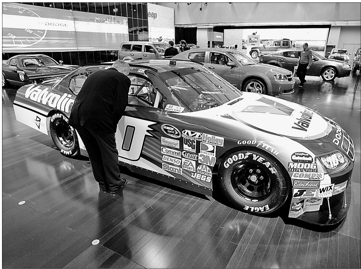
Il y a plusieurs façons de rêver en visitant ce salon automobile. Ce visiteur, lui, aimerait bien se glisser aux commandes de la Dodge Avenger que Patrick Carpentier pilotera lors de la prochaine saison de NASCAR.

En toute franchise, ce qui m'a plu cette année, c'est de retrouver un salon aux dimensions humaines dans une ambiance qui n'est pas sans rappeler celle des salons de Genève ou encore de New York. Un petit côté « cosy » qui nous change du gigantisme des grands salons internationaux. Pour qui aime l'automobile, ce salon de Montréal demeure fidèle à la tradition: une fête des sens, une longue flânerie et parfois même un lieu d'échanges, de discussions avec des gens que vous ne reverrez probablement jamais, mais qui sont de bonne compagnie, forcément, puisqu'ils sont