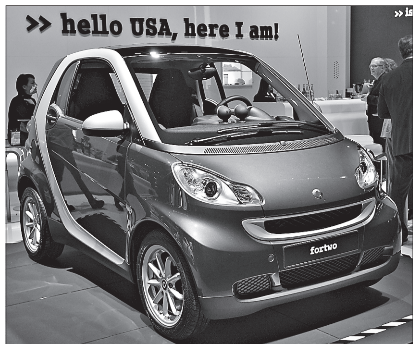
Smart vient de diffuser la liste de ses 74 premières concessions aux États-Unis. La Californie a 10 détaillants, suivie de la Floride (sept) et du Texas (cinq).

Un détail qui pourra intéresser les amateurs de caravanning, la nouvelle Smart (deuxième génération) peut être remorquée sur ses quatre roues. Le parfait tandem pour les gitans des temps modernes.