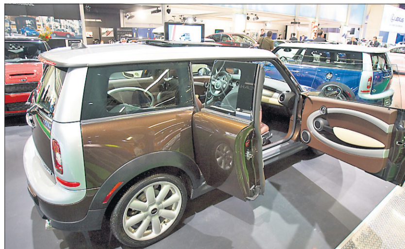
La Mini Clubman, une sous-compacte allongée avec portière inversée.

Les nouvelles normes sur la composition du carburant diesel ont coupé court à ce marché, pourtant très populaire au Québec. La société Volkswagen est probablement celle qui en a le plus souffert, mais c'est enfin chose