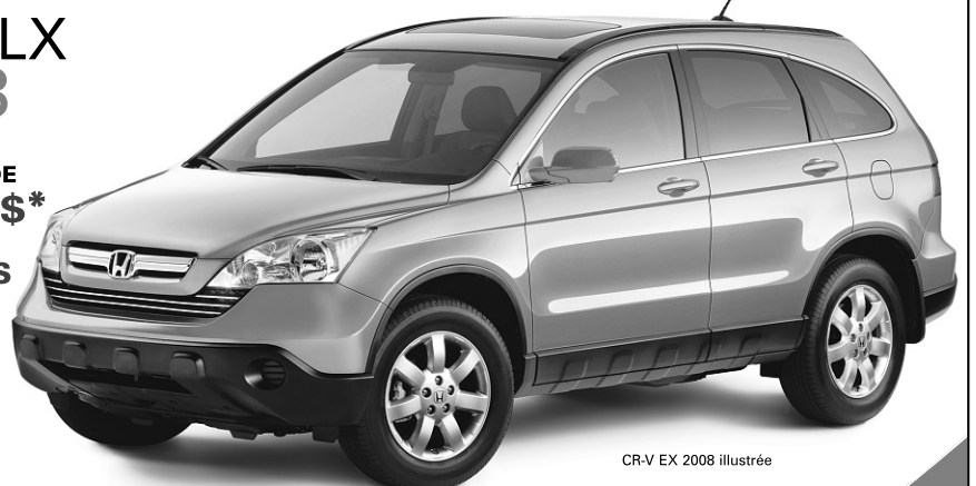
CR-V EX 2008 illustrée

LOCATION 48 MOIS À PARTIR DE 348$* PAR MOIS