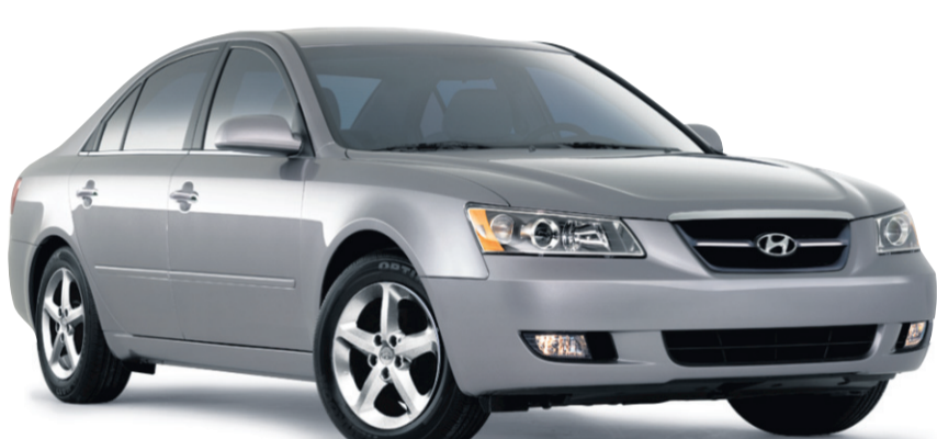
(MODÈLE SONATA GLS MONTRÉ)

SONATA GL 2008 4 cylindres, transmission automatique