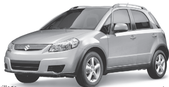
PDSF de 20 695 $*

Climatiseur / Glaces à commande électrique / Verrouillage électrique des portières / Rétroviseurs à commande électrique / Télédéverrouillage