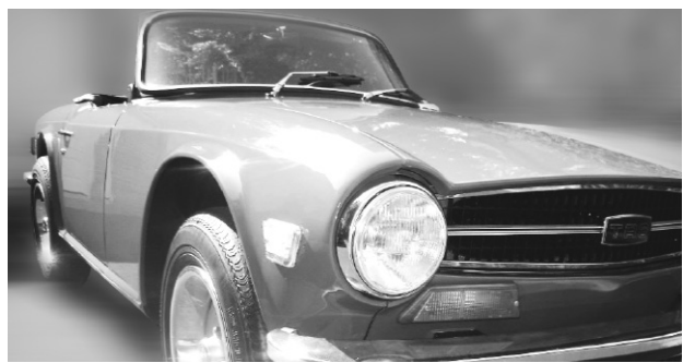
TRIUMPH TR6 1973

Voici les véhicules à contempler au sein de cette attraction: une Triumph TR6 1973, une Morgan 4/4 1600 Competition Duotone 1968, une Jaguar E-Type XKE 1968, une MGA 1961, une TVR S2 1990, une Austin Healey MK III 3000 1966, une Singer Nine Roadster 1948 et une MGB 1969, conduite pas l'acteur Michel Côté dans le film Cruising Bar 2 qui sera à l'affiche à l'été 2008.