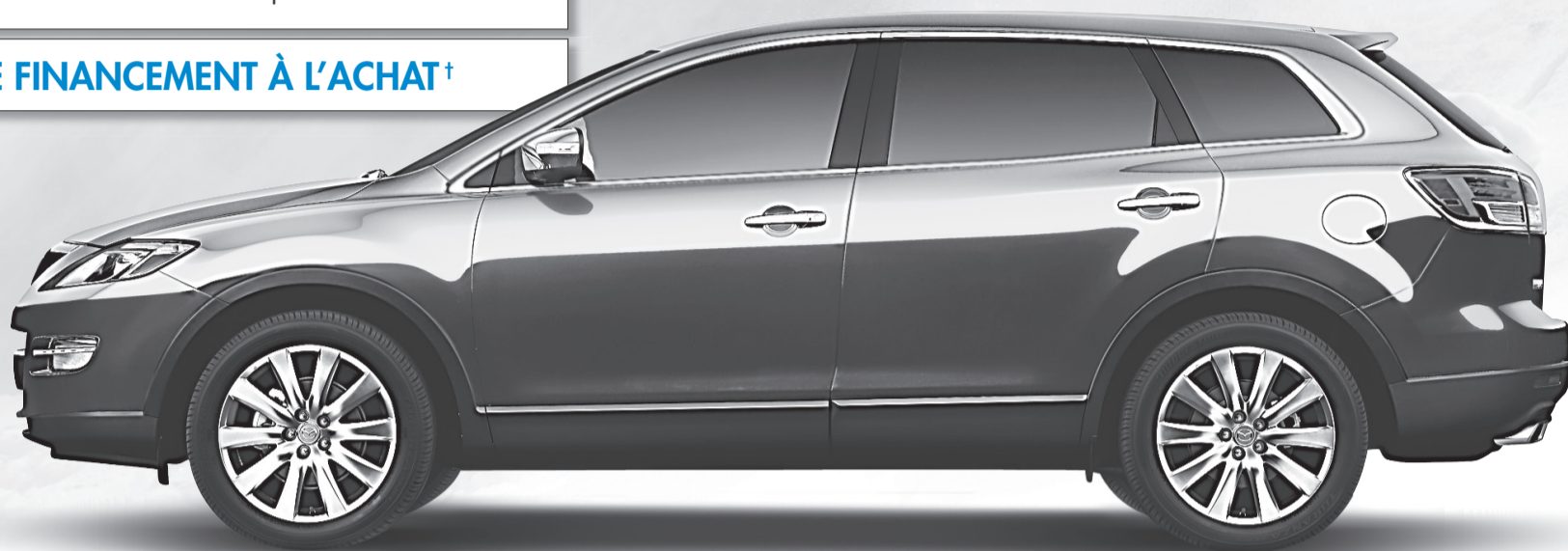
CX-9 GT illustré