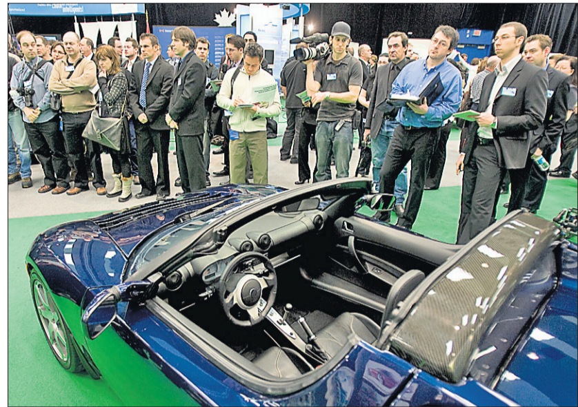
Le roadster électrique de la société Tesla Motors peut passer de 0 à 100 km/h en quatre secondes et peut parcourir 350 kilomètres sur une seule charge de trois heures.

mière canadienne au salon. Avec un moteur turbo de plus de 200 chevaux et 300 livres-pied à la clé, la sportive japonaise fait rêver depuis de nombreux mois déjà les amateurs de jeux vidéo à la Gran Turismo. Il faut dire qu'avec ses quelques retouches mécaniques et esthétiques, la sportive a la gueule de l'emploi.