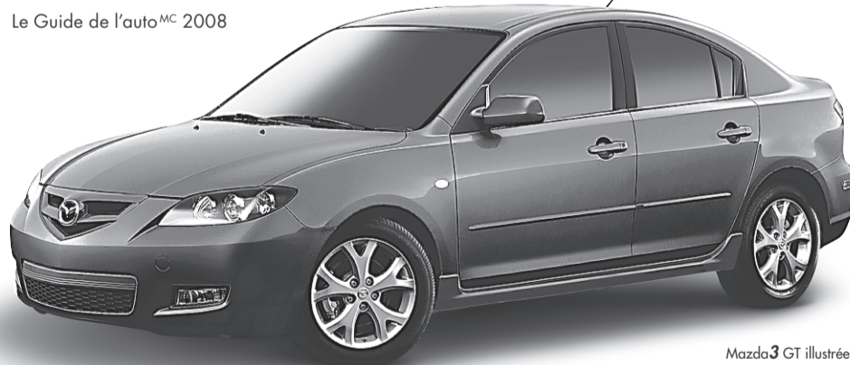
Mazda3 GT illustré

MEILLEUR ACHAT † Le Guide de l'auto MC 2008