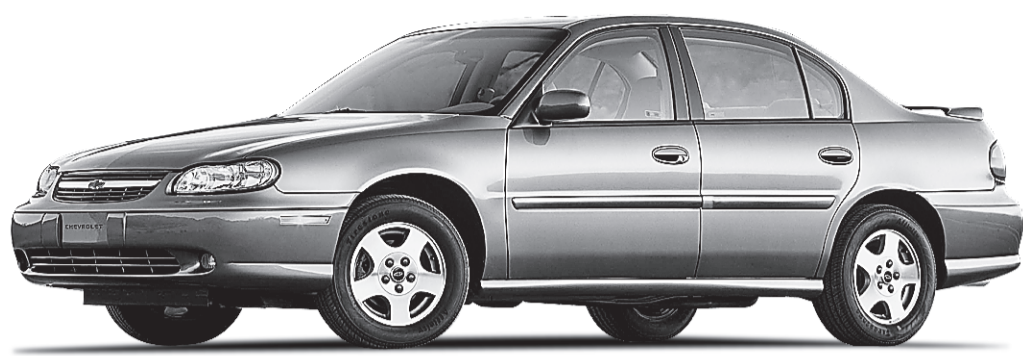
Chevrolet Malibu LS 2003

JEAN-FRANÇOIS GUAY VÉHICULES D'OCCASION COLLABORATION SPÉCIALE