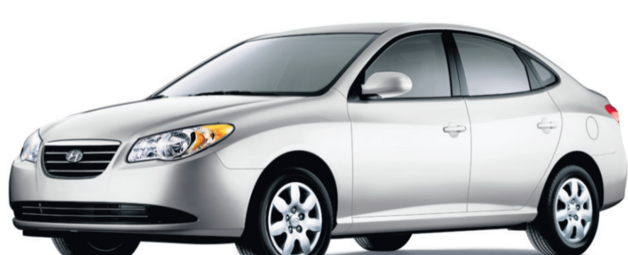
(MODÈLE ELANTRA GLS MONTRÉ)

8,56% TAUX DE FINANCEMENT EFFECTIF À L'ACHAT JUSQU'À 60 MOIS ††† calculé sur le prix comptant de 17 195 $