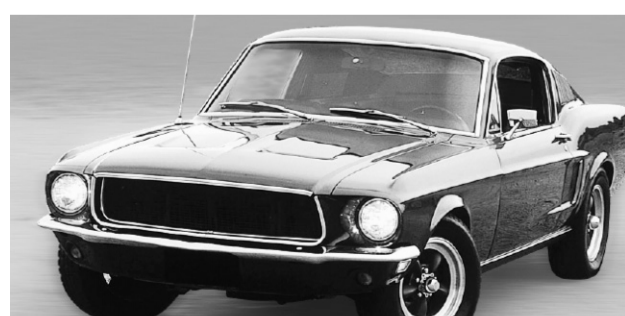
FORD MUSTANG GT390 FASTRACK (BULLITT) 1968

Cette attraction laisse une empreinte indélébile, sorte de touche mélancolique qui fera chavirer votre cœur en vous transportant vers des temps anciens... ici, le passé se conjugue simplement au présent!