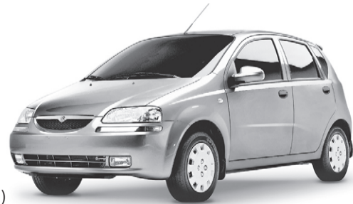
PDSF de 13 995 $*

Efficacité énergétique : 8,7 L/100 km en ville; 5,8 L/100 km* sur l'autoroute / Chaîne stéréo AM/FM/CD/MP3 (4 haut-parleurs)