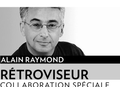
ALAIN RAYMOND RÉTROVISEUR COLLABORATION SPÉCIALE

Elle devait prendre son envol à Earls Court, au Salon de l'auto de Londres en 1940, mais sa naissance a été retardée jusqu'en 1947, question de donner à la Grande-Bretagne le temps de se remettre de la destruction qui a déferlé sur toute l'Europe pendant la Deuxième Guerre mondiale.