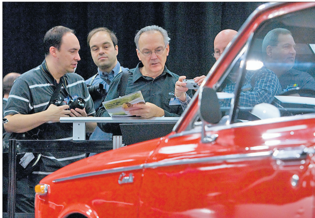
Les 40 ans du Salon sont soulignés avec l'attraction «40 ans... Toujours belles», qui permet d'admirer des véhicules exposés lors de la toute première présentation de l'événement. Ci-dessus, une Toyota Corolla 1969.

Parmi les attractions spéciales du Salon, on retrouve l'exposition 100% anglaises, présentée en collaboration avec le club auto-