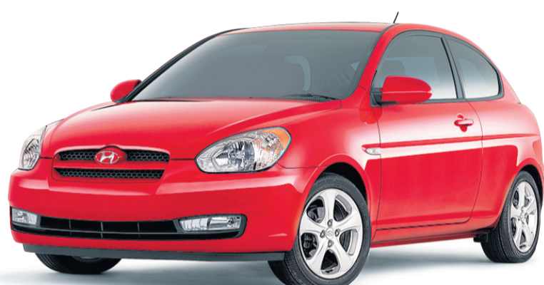
(MODÈLE ACCENT GL 3 PORTES SPORT MONTRÉ)

6,42% TAUX DE FINANCEMENT EFFECTIF À L'ACHAT JUSQU'À 72 MOIS ††† calculé sur le prix comptant de 19 995 $