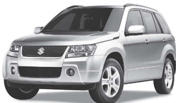
PDSF de 25 595 $*