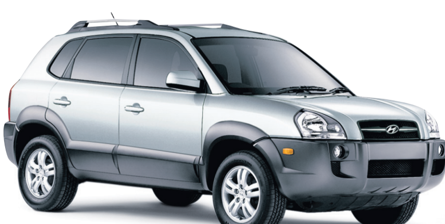
(MODÈLE TUCSON GLS MONTRÉ)

8,69% TAUX DE FINANCEMENT EFFECTIF À L'ACHAT JUSQU'À 60 MOIS ††† calculé sur le prix comptant de 10 995 $