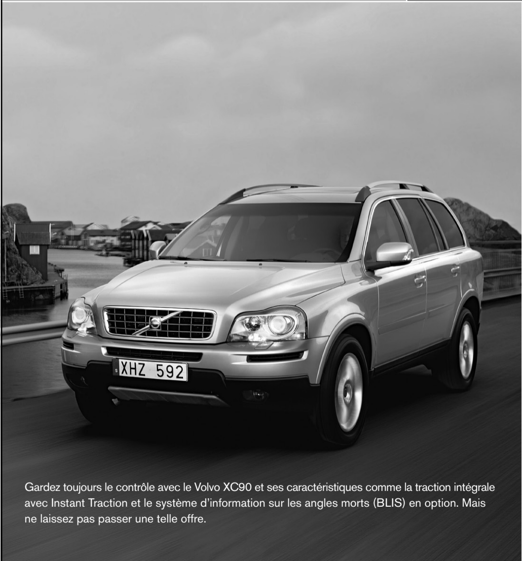
Gardez toujours le contrôle avec le Volvo XC90 et ses caractéristiques comme la traction intégrale avec Instant Traction et le système d'information sur les angles morts (BLIS) en option. Mais ne laissez pas passer une telle offre.