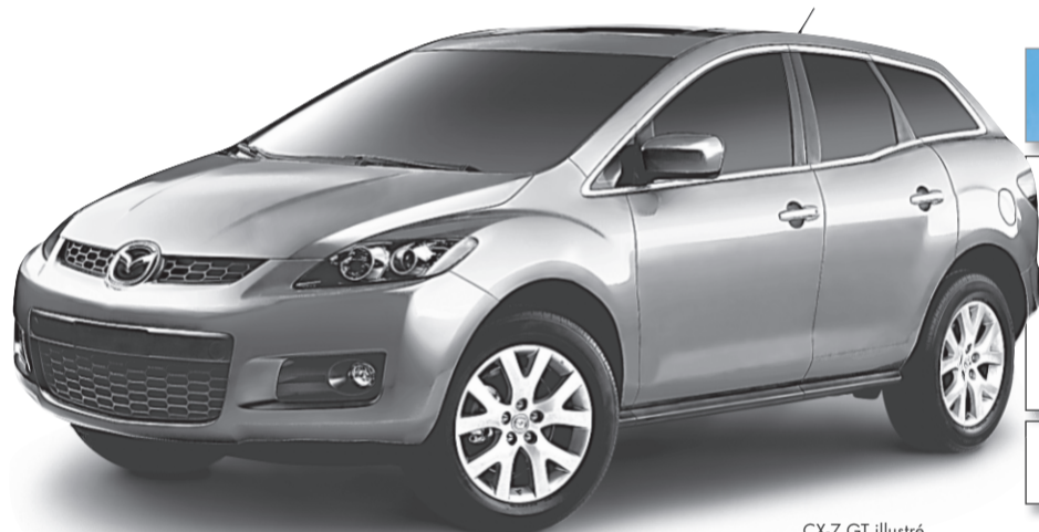
CX-7 GT illustré

OU OBTENEZ JUSQU'À 7500 $ EN CRÉDITS DU FABRICANT AUX CONCESSIONNAIRES SUR TOUS LES MODÈLES 2007 NEUFS EN INVENTAIRE. ††