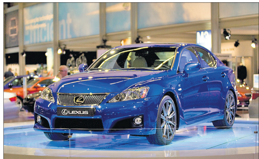
En première canadienne: la Lexus IS-F 2008.

Mitsubishi est au Canada depuis quelques années et les mordus de performance lui ont demandé sans cesse d'importer la légendaire Lancer Evo, une version sur les stéroïdes de la compacte Lancer. C'est chose faite, puisque la Lancer Evolution X est en pre-