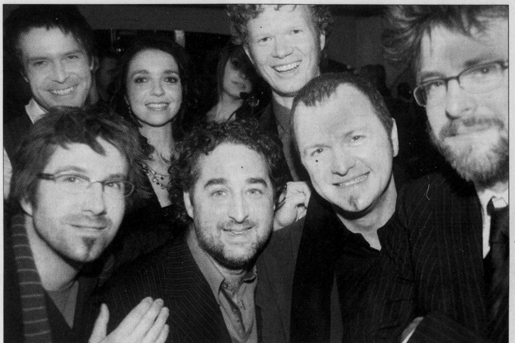
PEDRO RUIZ LE DEVOIR

Les gars et la fille du groupe Mes Aïeux, tout sourire, hier au Théâtre Saint-Denis, sont les grands gagnants du 29 e gala de l'ADISQ.