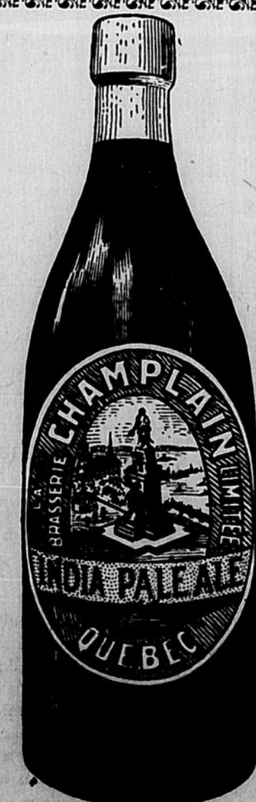
La Bière et le Porter CHAMPLAIN sont les favoris des sportifs