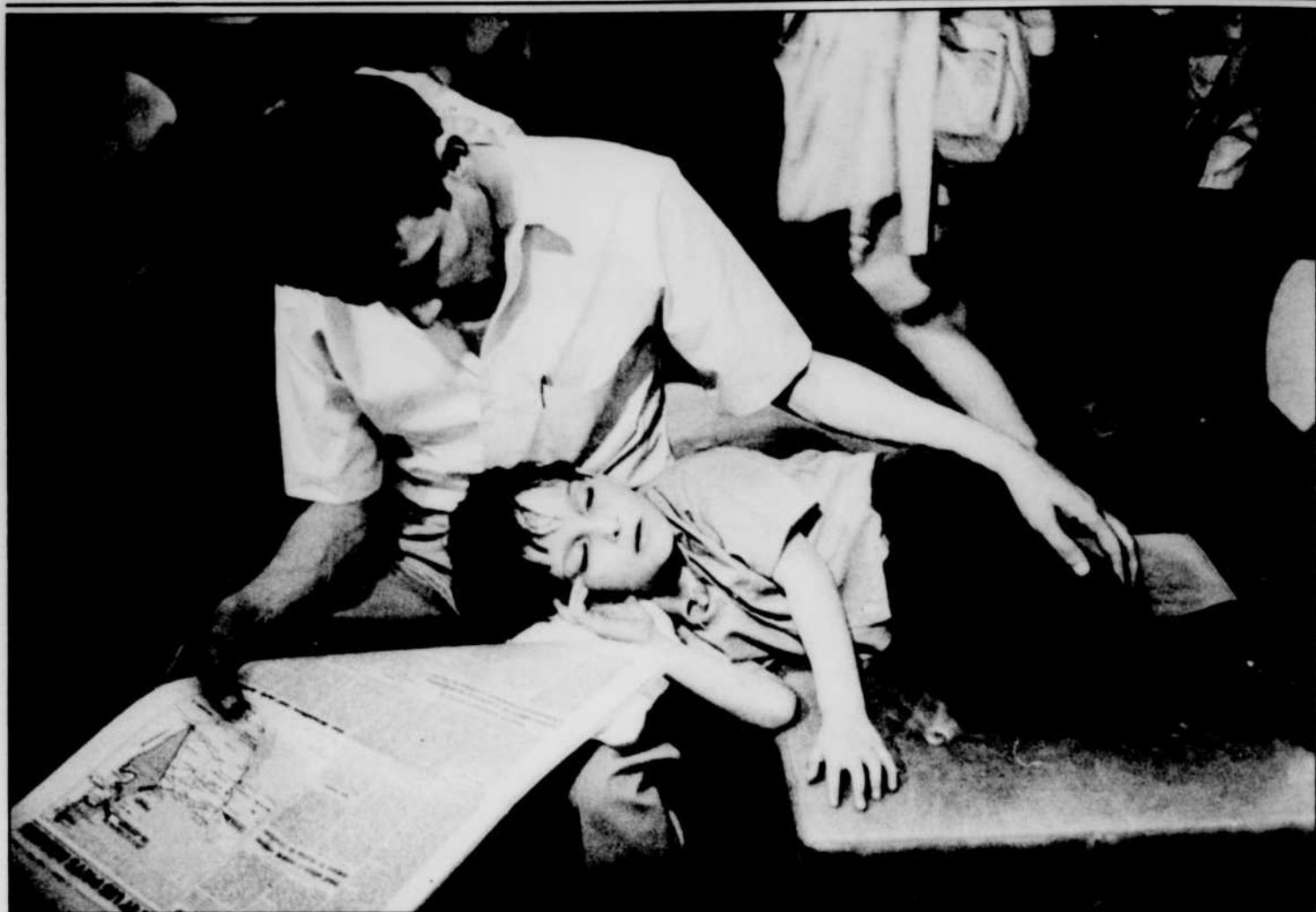
«Le repos», photo gagnante prise à l'Expo par Marc Lemieux.