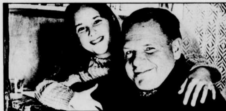
Lawrence DURRELL et sa femme

Par ce livre, il se libérait de ce qu'il appelait «la mort anglaise» et de l'influence éventuelle de Miller.