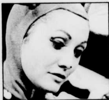
«La Souris verte», à 10 h 45.