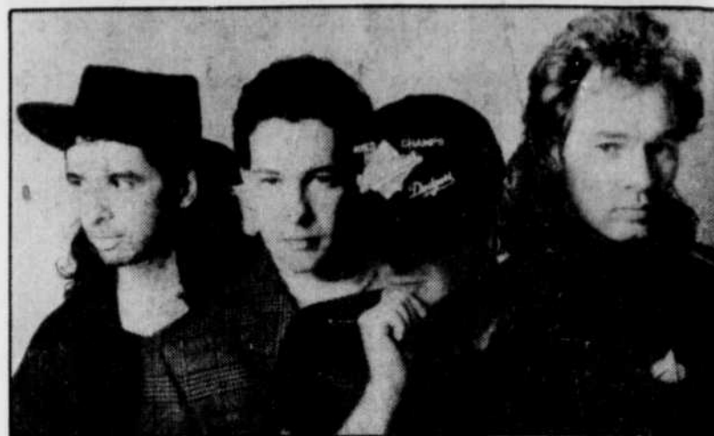
Le groupe Glass Tiger

Ce guitariste passionné par le blues a inlassablement sillonné les routes européennes pour ré-