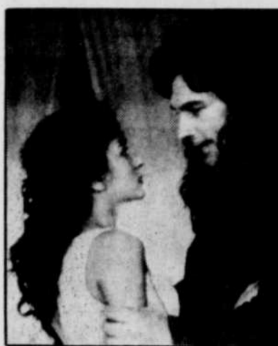
Timothy Dalton joue le rôle du roi, tandis que Valeria Golino fait une Jeanne crédible, au fort caractère.

Dans cette superproduction européenne, le cinéaste Corti a eu droit aux gros canons de la distribution, dont le nouvel « Agent 007 », Timothy Dalton dans le rôle du roi. Celui-ci donne libre cours au gonflement de ses muscles, la nature du personnage l'exigeant. Valeria Golino fait une Jeanne crédible, au fort caractère.