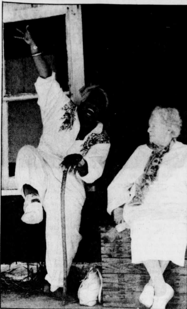
Le 17 avril, coup d'envoi de La Mondiale de films et vidéo, avec « The Company of Strangers » (Le fabuleux gang des sept), de Cynthia Scott, qui représente le Québec.