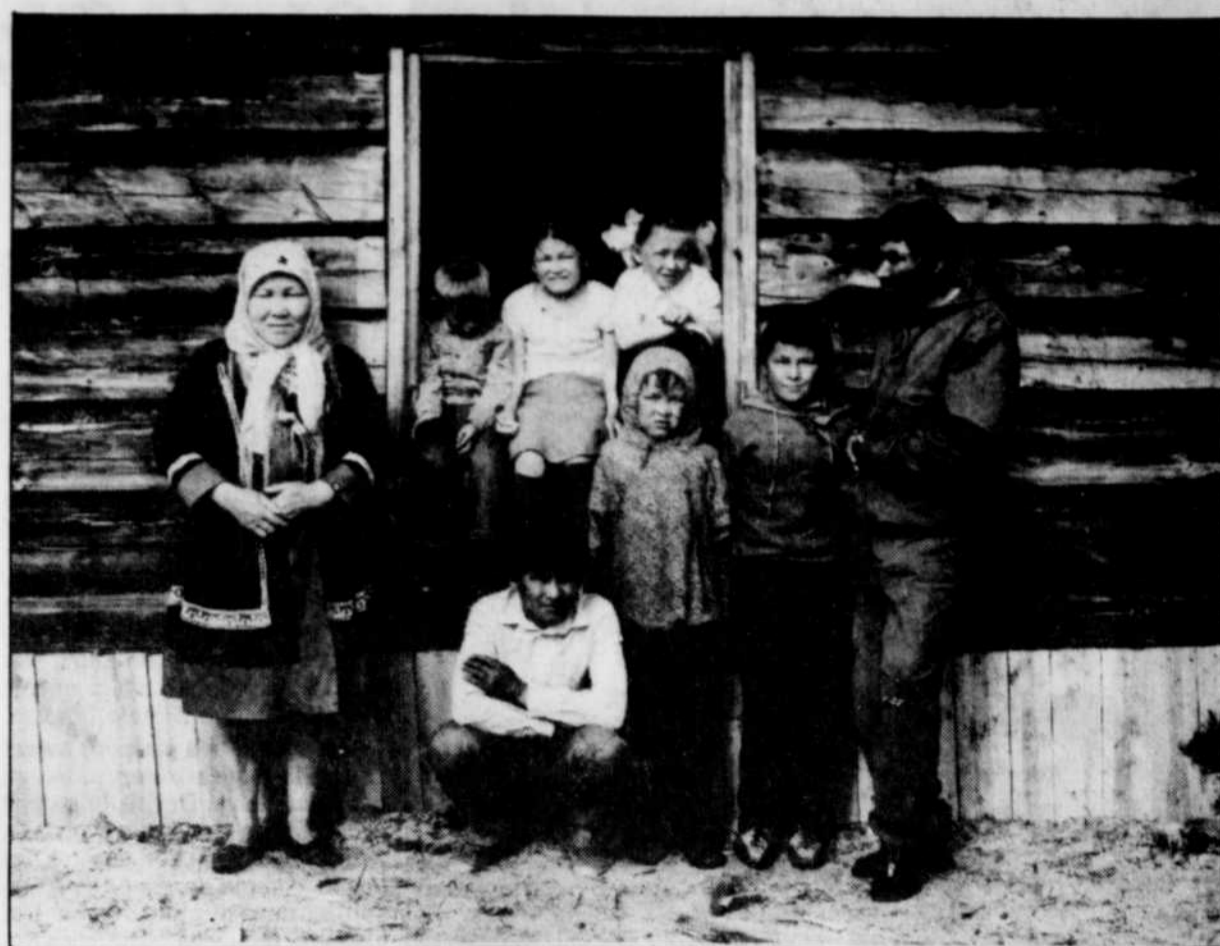
« Le berceau » est un documentaire soviétique récent sur les menaces écologiques pesant sur les peuples autochtones de Sibérie et qui n'est pas sans rappeler notre Baie James.

Les femmes d'ici n'aiment sûrement pas être forcées de tenir des festivals de films consacrés à leur travail, comme autrefois les journaux quotidiens les marginalisaient dans des pages réservées à leurs activités. Puisque la Mondiale est nécessaire, aussi bien en profiter.