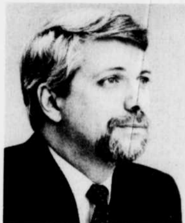
NDLR Pierre-Marc Johnson annonçait récemment qu'il se portait candidat à la présidence du Parti québécois. Voici de larges extraits de discours qu'il prononça à cette occasion.

L'élection à la présidence du Parti québécois concerne l'ensemble de la population. D'abord, parce que tous ceux et celles qui sont membres du Parti québécois, ou qui le deviendront d'ici le 15 août, voteront pour le candidat ou la candidate de leur choix. Cet exercice démocratique sans précédent dans nos annales donne à tous et à toutes une occasion extraordinaire de s'impliquer dans la vie politique du Québec. Ensuite, parce que l'élu (e) deviendra Premier ministre du Québec.