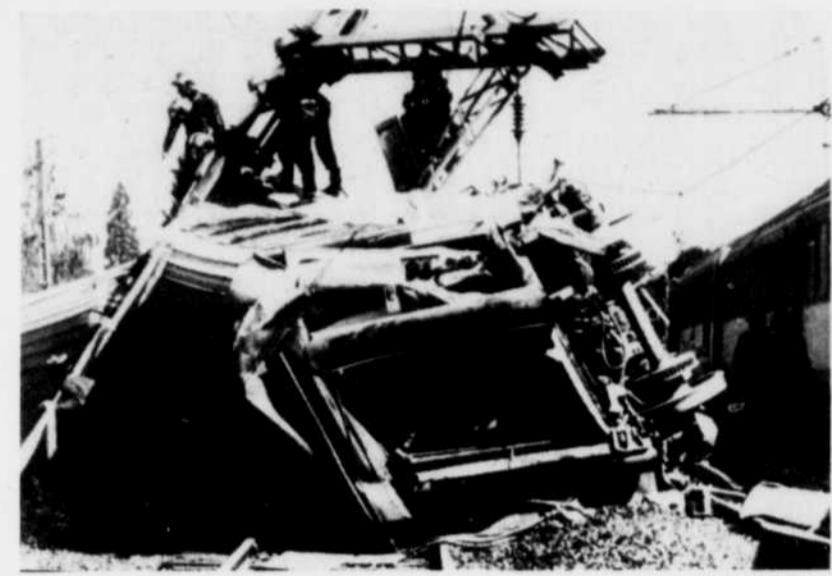
Les morts et les blessés évacués, des équipes ont entrepris le dégagement de la voie bloquée à la suite du drame de Saint-Pierre-du-Vauvray.

de la circulation qu'a emprunté le camionneur. Un virage qui oblige à ralentir.