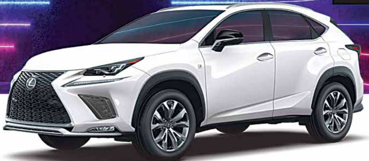
NX 300 F SPORT Series 1 Shown