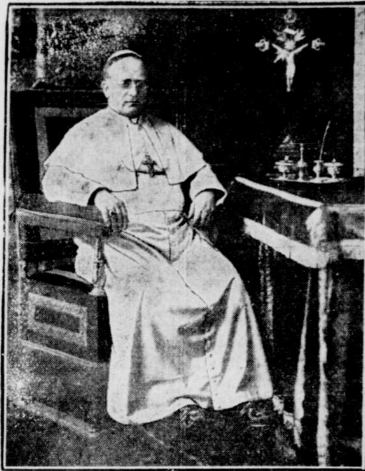
S. S. le Pape PIE XI qui célèbre aujourd'hui le 14 e anniversaire de son élévation sur le trône de Saint-Pierre. Sa Sainteté est âgée de 77 ans.