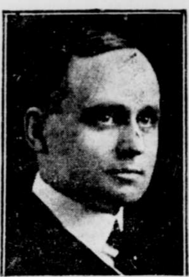
L'HON. P. F. CASGRAIN, député libéral de Châteauguay-Saguenay qui a été nommé aujourd'hui président de la Chambre des Communes, à l'ouverture de la session. M. Bennett s'est opposé à sa nomination.

OTTAWA, 6. — Maintenant que le Dominion et les provinces ont décidé de porter une plus lourde part du fardeau du secours-chômage, les municipalités devraient veiller davantage à ce que l'argent ne soit pas gaspillé ou dépensé inutilement, a déclaré l'hon. Norman McLeod, ministre du Travail.