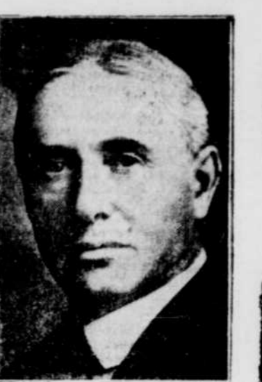
L'HON. LYMAN-P. DUFF, juge-en-chef de la Cour Suprême du Canada, qui a présidé à l'ouverture de la session, ce matin, comme assistant du gouverneur-général.