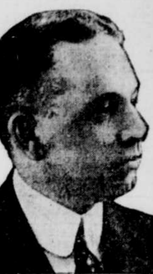
L'HON. WALTER-E. FOSTER, ancien premier ministre du Nouveau-Brunswick, qui a été nommé par le cabinet, président du Sénat en remplacement de l'hon. P.-E. Blondin.