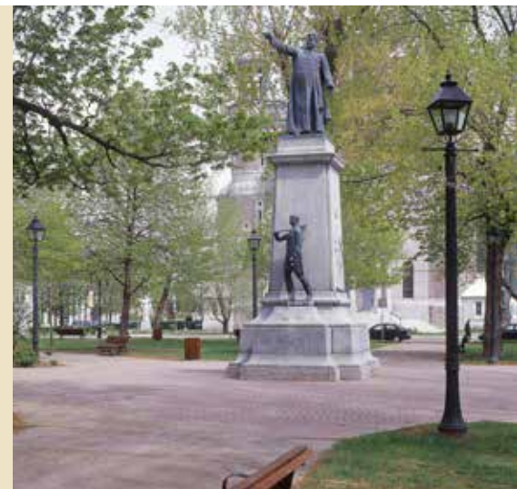
Des améliorations seront apportées au parc Labelle.

Le parc Labelle sera au coeur des attentions de la municipalité en 2016 alors qu'on mettra en valeur ses attraits, dont un éclairage d'ambiance pour la statue et la cathédrale ainsi que du mobilier, un nouveau revêtement de sol et de l'aménagement paysager.