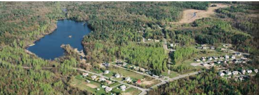
En 2016, la Ville réalisera un plan directeur pour mettre en valeur le lac Jérôme.

En devançant l'adoption en octobre, la Ville souhaite obtenir de meilleurs prix lors des appels d'offres et entreprendre les travaux plus tôt dans l'année.