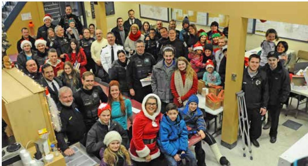
Voici tous les policiers et bénévoles engagés lors de l'édition 2014.