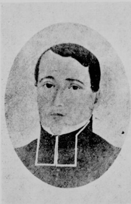
LE RÉVÉ M. BÉLANGER

Mais la nuit n'était pas encore au milieu de sa course, et s'arrêter pour attendre le jour, c'eût été vouloir périr, saisi par un frisson mortel : il fallait marcher. Ils continuent donc, trouvant dans l'espoir