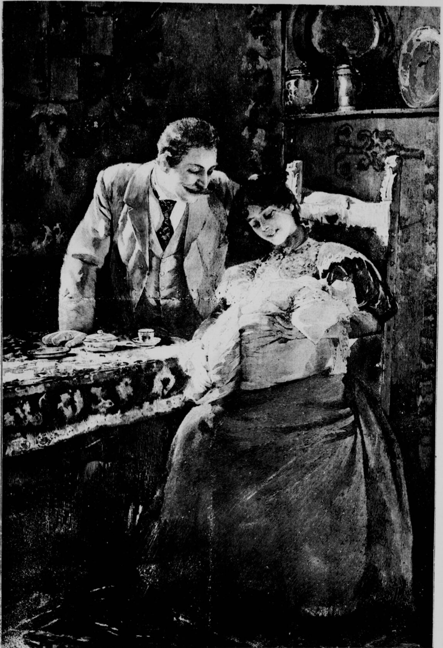
BEAUX-ARTS. — L'heureuse mère