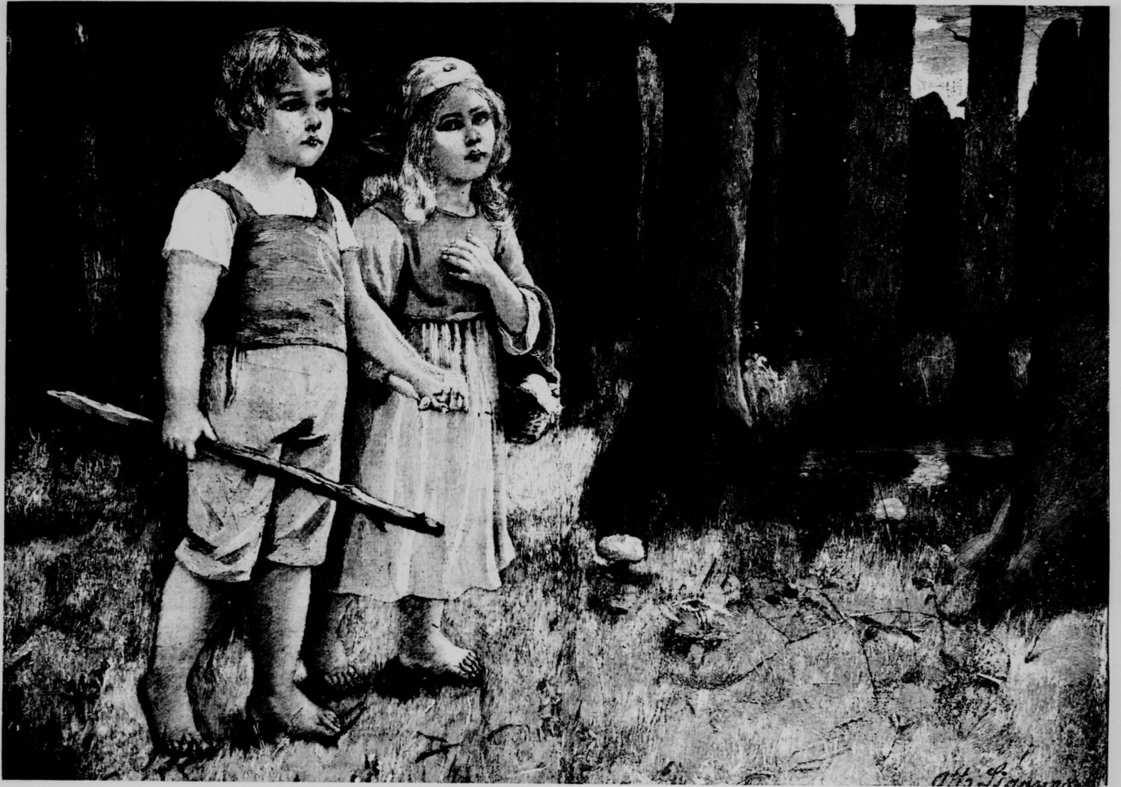
BEAUX-ARTS. — Les enfants au bois