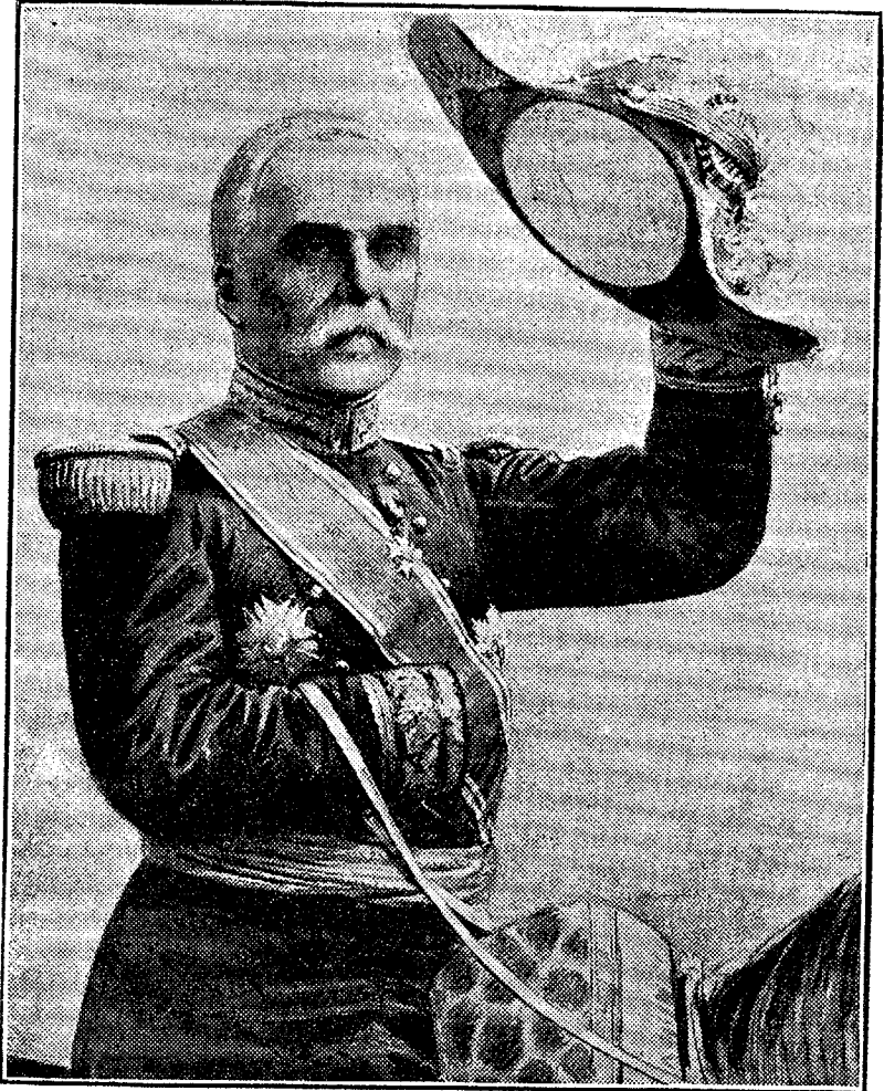
Le Général PAU qui honora le Canada de sa visite, en mars 1919.