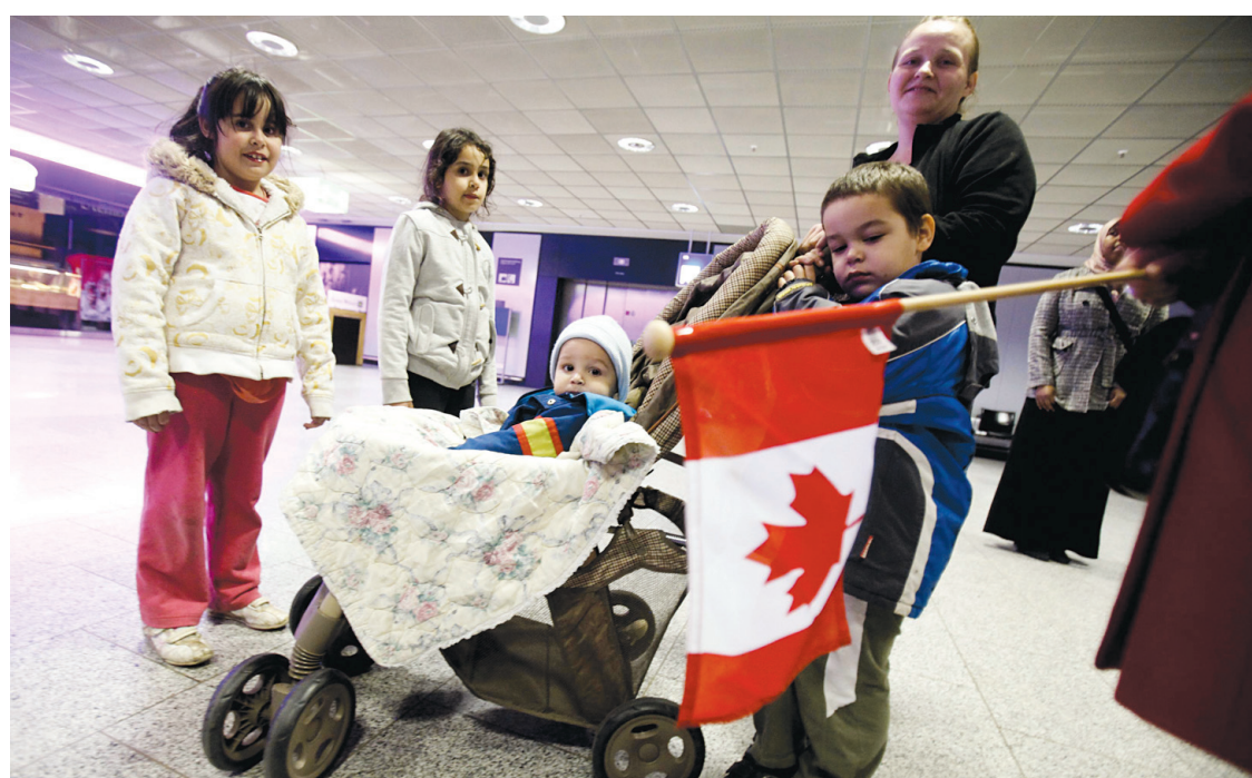
Des touristes canadiens sont arrivés hier soir à Francfort, au départ du Caire.