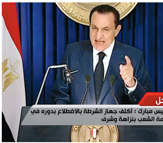
Le président Hosni Moubarak s'adressant aux Égyptiens à la télévision, hier, leur promettant de quitter le pouvoir dans quelques mois.

La Grande-Bretagne a réitéré son appel aux au-