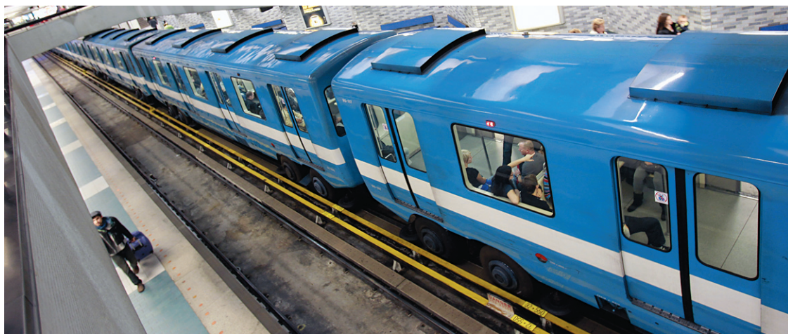
Les commanditaires choisis par la STM pourront entre autres voir leur logo apposé sur les plans du réseau, sur les voitures de tête du métro et sur les guérites des changeurs.

Ce comité sera formé de quatre membres, soit deux re-