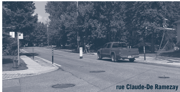
rue Claude-De Ramezay