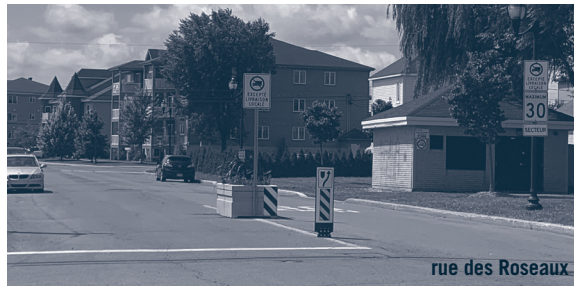
rue des Roseaux