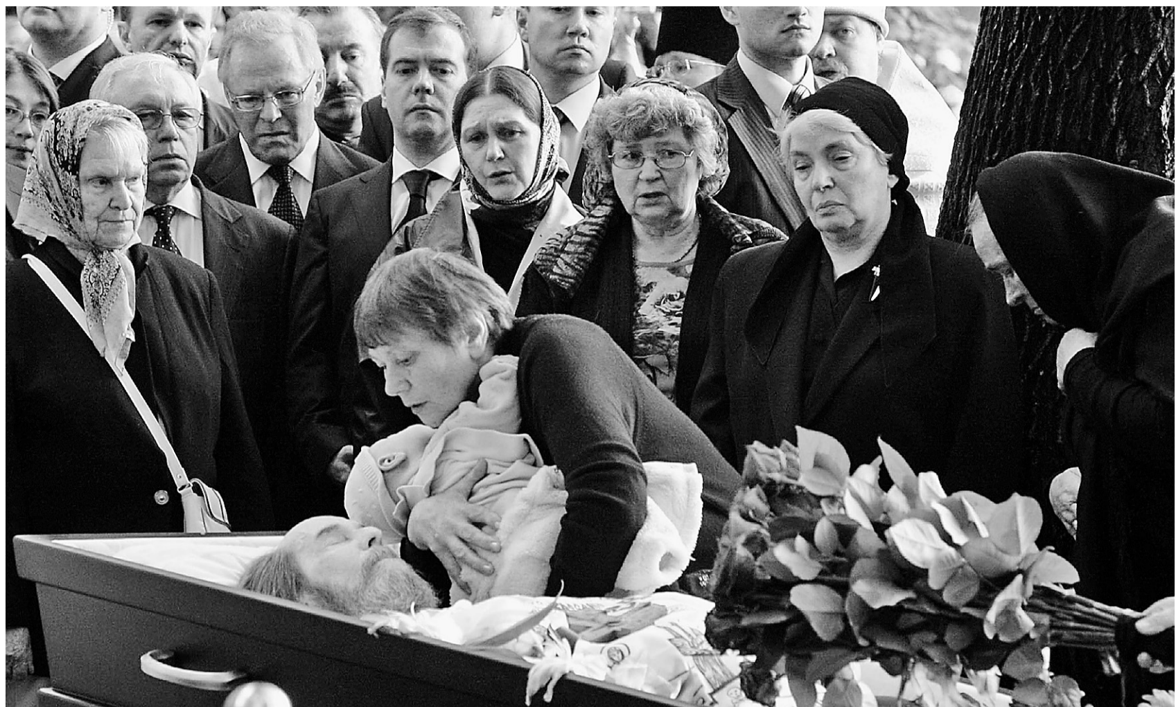
Alexandre Soljenitsyne a été inhumé hier à Moscou en présence d'une foule compacte venue le saluer une dernière fois sous les yeux du président russe Dmitri Medvedev (ici à l'arrière-plan).

Le premier ministre, Vladimir Poutine, a néanmoins largement éclipsé Dmitri Medvedev, qui lui a succédé en mai au Kremlin, dans