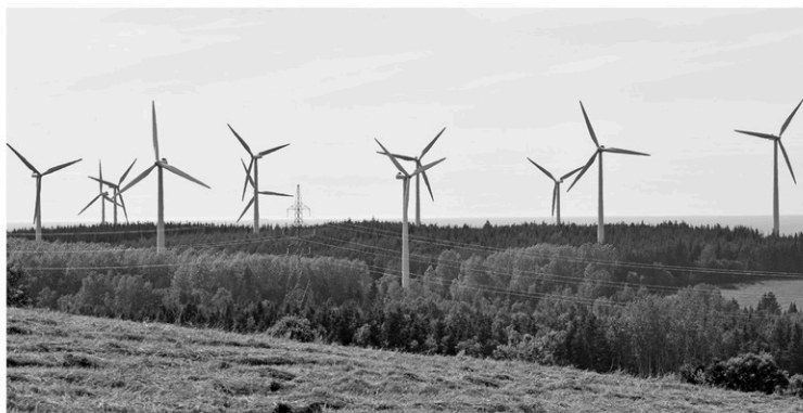
Le développement record des énergies renouvelables illustre la baisse des coûts de l'éolien et du solaire photovoltaïque.

Autre élément significatif: cette forte croissance des énergies renouvelables s'est accompagnée d'une baisse de 23% des montants investis par