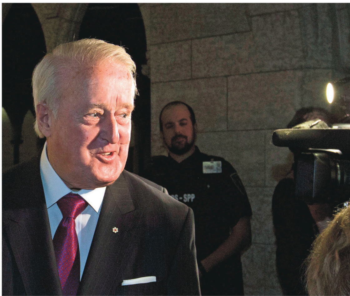
L'ancien premier ministre conservateur Brian Mulroney à la sortie de sa rencontre avec des membres du conseil des ministres du libéral Justin Trudeau

Quant au reste du contenu de la lettre, l'am-