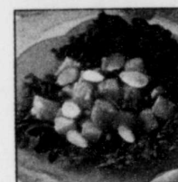
Salade de melon