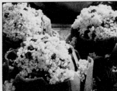
ARCHIVES LE SOLEIL Du couscous, pour faire changement

Inscrivez ensuite sur une feuille les plats principaux. Dans bien des cas, prévoir les soupers peut suffire, si les quantités préparées en laissent assez pour un autre repas. Ajoutez quelques idées d'accompagnements qui conviennent aux mets déjà prévus, tels que les légumes ou les féculents (riz, pâtes, pommes de terre, millet, couscous). Et finalement, servez-vous du menu planifié pour faire votre épicerie en conséquence. Une suggestion: conservez les menus que vous rédigez et réutilisez-les périodiquement.