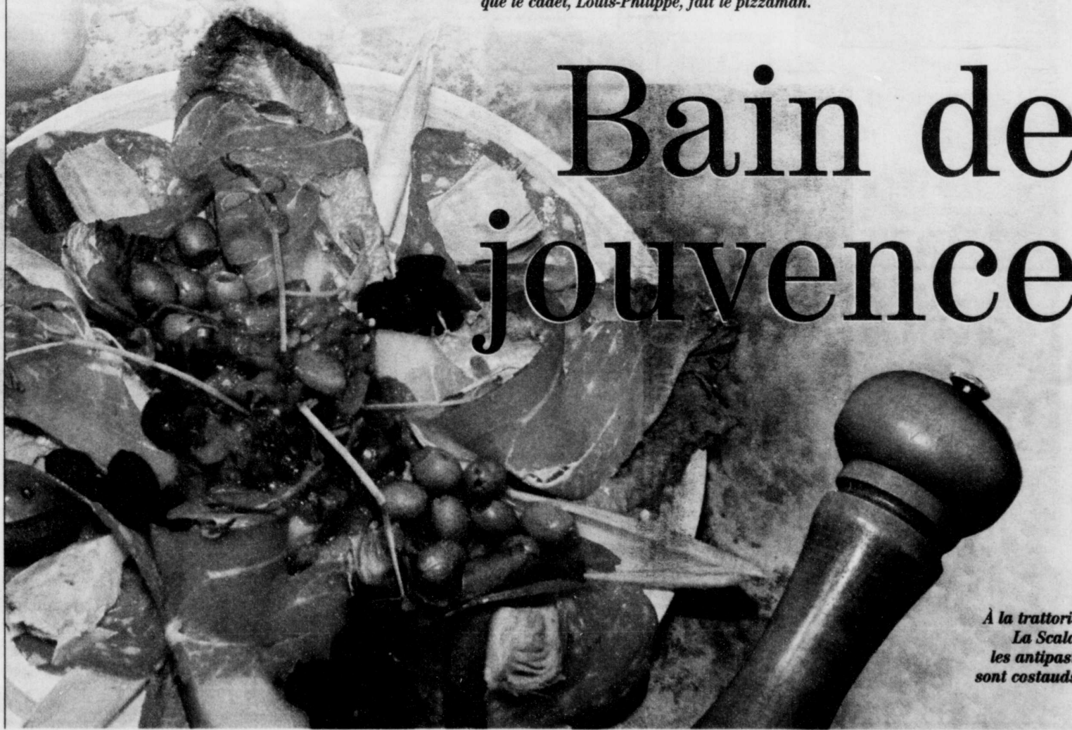
À la trattoria La Scala, les antipasti sont costauds.