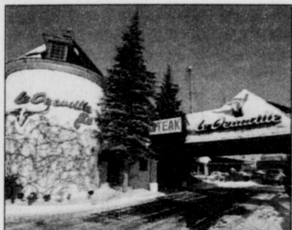
LE SOLEIL, PATRICE LAROCHE Le Deauville est devenu un Burger King.